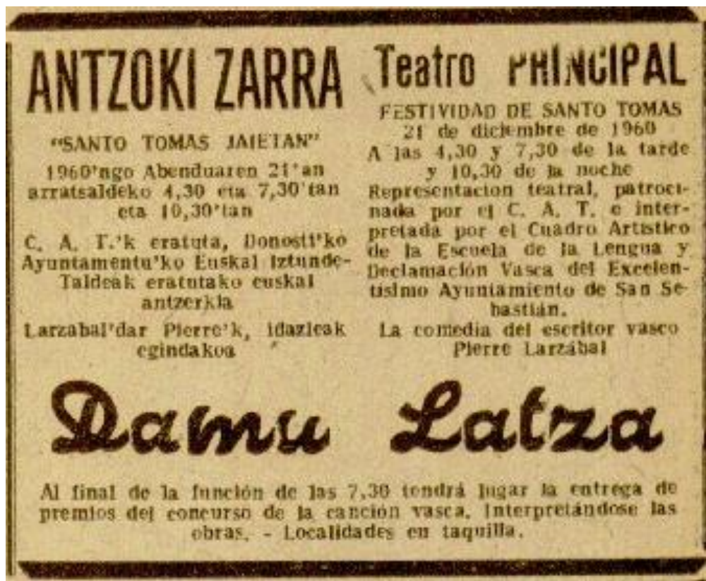
El Diario Vasco 1960-XII-21