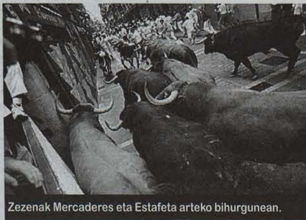
Zezenak Mercaderes eta Estafeta arteko bihurgunean.

jo zuten, edozein zokotan Koldoren hezur txikitua ikusiko zituztelakoan. Bihurgunera iritsita, han zetzan, bai, Gurutze Gorrikoen ohatilan, ahoz gora, kamiseta zarrastatua zuela. «Lasai, ez dik deus, azaleko urradura buruan, eta alimaleko legatza, hori bai. Gaitzerdi, miurak adarra bularrean sartu ez dionean». Gurutze Go-