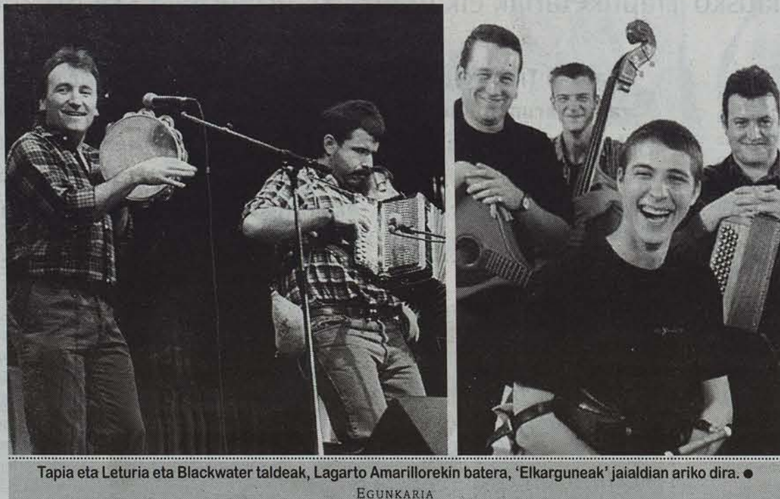
Tapia eta Leturia eta Blackwater taldeak, Lagarto Amarilloekin batera, 'Elkarguneak' jaialdian ariko dira. •

Herri musikaren IV. jaialdia egingo dute San Nicolas plazan uztailearen 16, 17 eta 18an