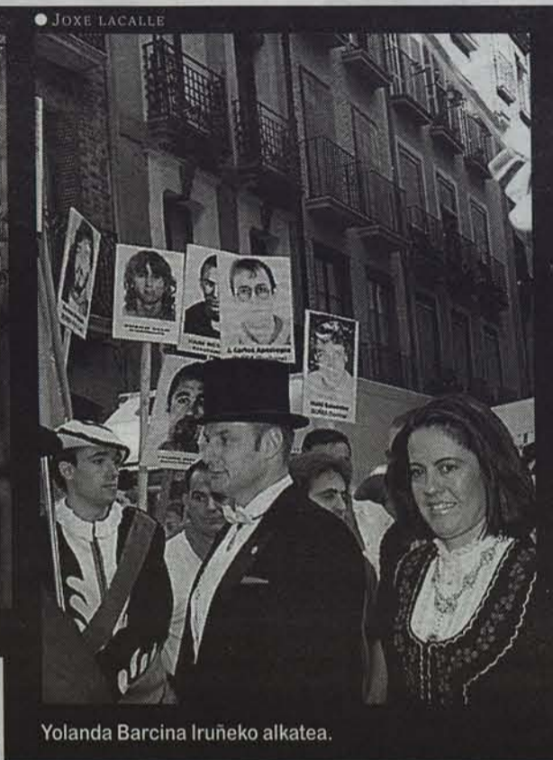
Yolanda Barcina Iruñeko alkatea.

no ugari zegoen manifestarien artean. Lasterraldi politik ikusteko parada izan zen. Halere, harrapaketarik izan zen, borrakada bat baino gehiago. Azken ohar bat: polizia batek, nire albotik laster batean igaro zelarik, bultza egin zidan. «Barkatu», esan zidan. Barkatu! Zahartu gara, zahartu garenez.