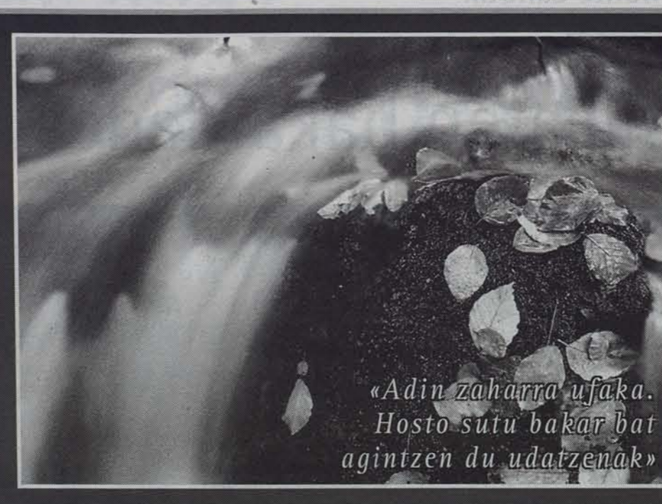
«Adin zaharra ufaka. Hosto sutu bakar bat agintzen du udutzenak»