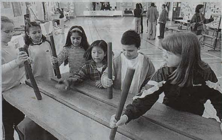
Kulturen arteko trukaketa sustatzeko asmoz, Kulturen Astea egin dute, bigarrenenez, Lizarrako Remontibal eskola publikoan.