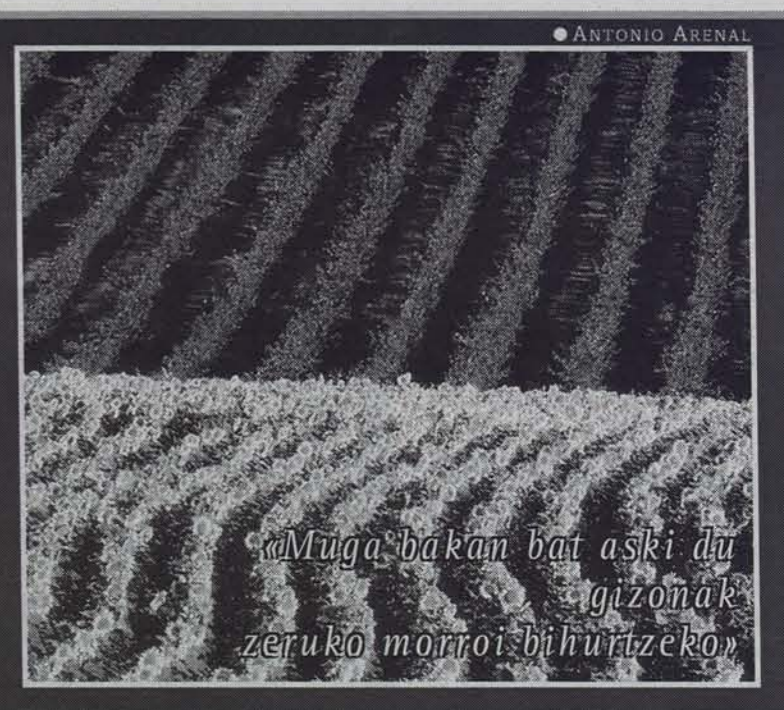
«Muga bakan bat aski du gizonak zeruko morroi bihurtzeko»