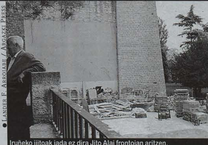
Iruñeko ijitoak jada ez dira Jito Alai frontoian aritzen.