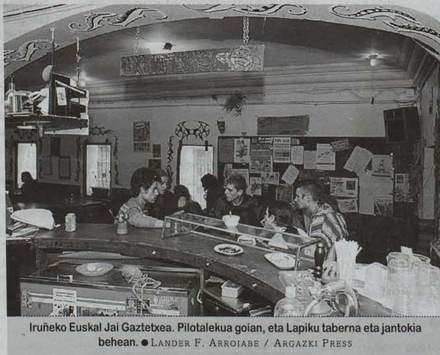
Iruñeko Euskal Jai Gaztetxea. Pilotalekua goian, eta Lapiku taberna eta jantokia behean.

Igandean ere egonen da egitekorik. Goizean, futbol partidak izanen dira, eta arratsaldean, patinatze U-aren inaugurazioa egingen da, irristailuen eta txirinduen erakustaldiarekin. Iluntzean, berriz, zinema. Astelehenean eta asteartean, antzerki emanaldiek amaiera emanen diote aurtengo ospakizunari.