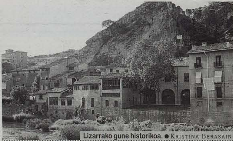
Lizarrako gune historikoa. • KRISTINA BERASAIN