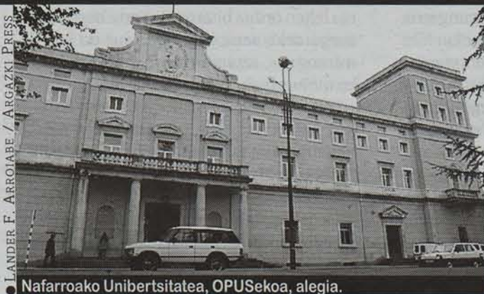
Nafarroako Unibertsitatea, OPUSekoa, alegia.

Behin, han, —Andonik historia ikasi zuen— Eraikin Zentralean terterter ari zitziguan Ignacio nazkante hura, harekin