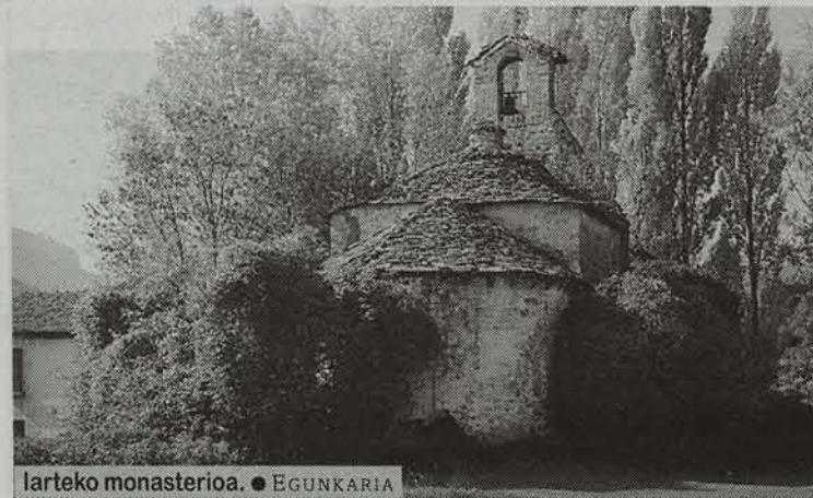
Iarteko monasterioa. • EGUNKARIA