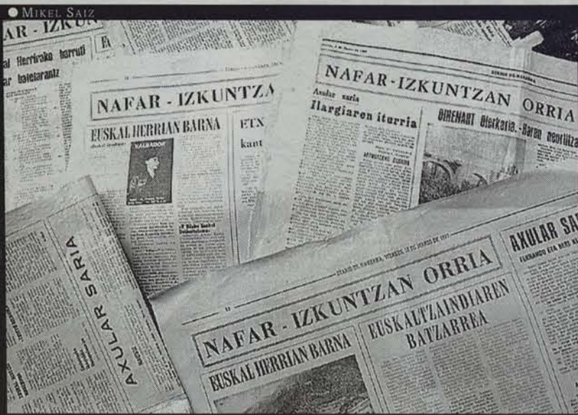
Nafar Izkuntza, Diario de Navarra-ko euskarazko orrialdea.

Ongi-etorri salatzailea. Ez dago jakiterik alargunak zertan ematen duen eguna, bere bizitza pribatua, jakina, pribatua baita, baina badago jakiterik goiza berandu arte lotan ematen duela, hain justu Nafarroako egunkaririk saldueneko harpidedun delako.