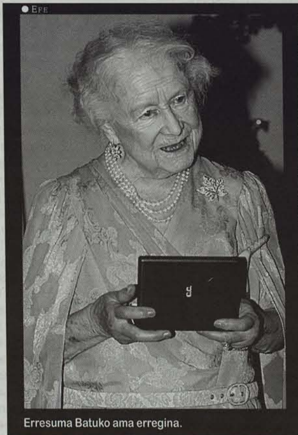
Erresuma Batuko ama erregina.