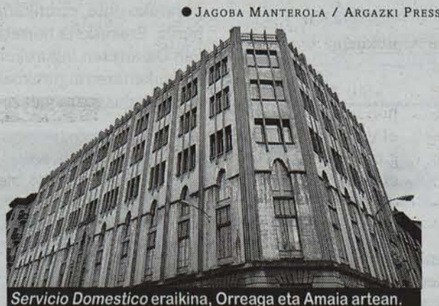
Servicio Doméstico eraikina, Orreaga eta Amaia artean.

Urteak joan, urteak etorri, Maria Inmakuladako mojak bertze zerbait irakasten hasi ziren, bertze zerbitzu batzuk eskaintzeaz gainera. Lehen solairua emakume dirudunendako zahar-etxea zen; bigarre-