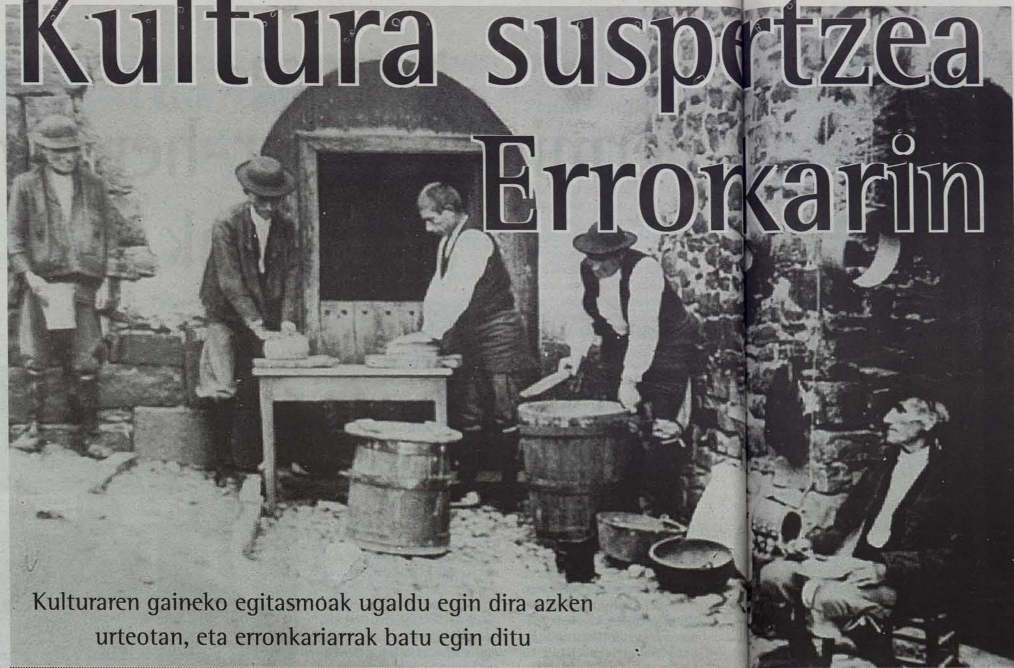
Kulturaren gaineko egitasmoak ugaldtu egin dira azken urteotan, eta erronkariarrak batu egin ditu

Beste hainbat gauzarekin egin bezala, argazki zaharrak berreskuratzeko egitasmoa ere abiatu dute Erronkarin. Irudian, Izabako herritar batzuen gazta egiten, 1924an.