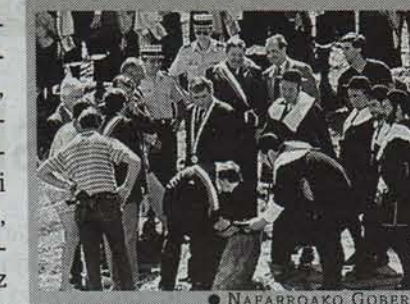
● NAFARROAKO GOBERNUA

Urtero, uztailean 13an, Biarnokoek Izaba, Garro, Uztarroze eta Urzainkioei hiru behi ematen dizkiete, Erronkariko lurretan 28 eguneha ura eta larrea erabiltzearen truke. 1375etik urtero berretsi da akordioa, eta gaur egun besta handia da. Urzainkin horren inguruko museoak egin nahi dute, eta orain, aurreproiektua egiten ari dira, museoak paratzeko eskaera egiteko.