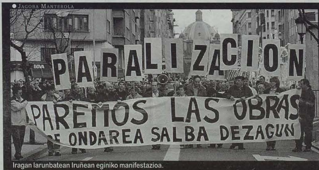
Iragan larunbatean Iruñean eginiko manifestazioa.