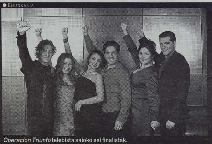
Operación Triunfo telebista saiko sei finalistak.