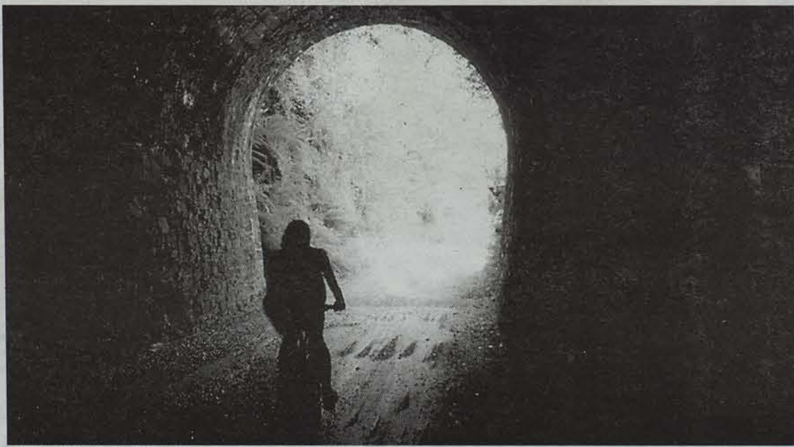
Doneztebe eta Endarlatsa lotzen dituen bide berdea.