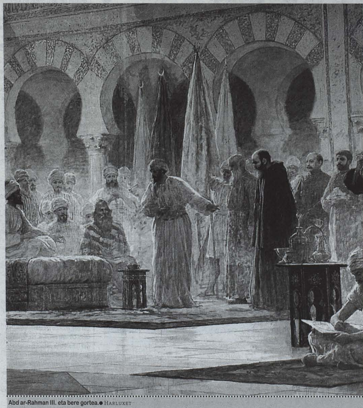
Abd ar-Rahman III. eta bere gortea.

'Zangozako arbasoak omen zituen kalifa entzutetsuak 924 urtean Nafarroako hainbat herri suntsitu zituen