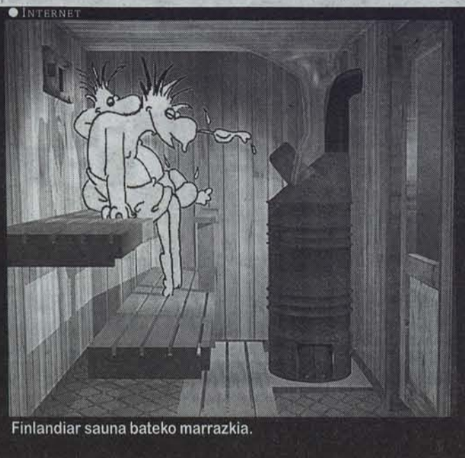
Finlandiar sauna bateko marrazkia.

Idiak eta errealtatea. Ni jaio nintzenetik naiz Iruñeko Tenis Elkarte-ko bazkide. Eta zenbaitetan saunara jotzen naiz. Zehatzago adierazita, nire zabalkuntza pertsonal prozesu gero eta azkarragoak arratsaldean Monte Carlo mus partidatik aldentzeko behar bezainbeste agobiatzen nauen aldi oro. Azken egunotan, Eguberrietako gehiegikerien ondotik, egunero lehen mus partida burutu bezain pronto abiatzen naiz Teniserantz. Halaxe egin dut gaur, geratzen zitzaidan kuba-libre erdia urrupada bakarrean edanda. Saunara heldu naizelarik, mukuru beteta topatu dut: nire tonelaje bereko dozena erdi idi izerdi patsetan. Zoofiliko ez garenontzat, erotismo zipitzik ere ez. Jai-