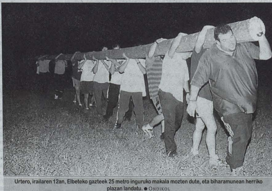
Urtero, irailaren 12an, Elbeteko gazteek 25 metro inguruko makala mozten dute, eta biharamunean herriko plazan landatu. ● ONDIKOL

A SPALDITIK ZEBILTZAN ELBETEKo gazteak Makal Landatze Eguna antolatu nahirik. Urtero, irailaren 12an, Elbeteko gazteek 25 metro inguruko makala mozten dute, biharamunean herriko plazan landatzeko. Bestak akabatzen direnean, arbola bota eta egurretarako erabiltzen da. Aunitzetan, makala «lapurtzera» joan eta lurrera erortzen denean erditik hausten da. Makal aunitzek «taladroa» izeneko eritasuna dute. Barne-tik usteltzen dira zuhaitza hiltzen den arte. Bestalde, makalaren egurra gero eta gutiago erabiltzen da (20 urte inguru kostatzen zaio zuhaitzari handitzea); eta, adibidez, pinuaren egurra askoz merkeagoa da. Era berean, Elbeten betidanik izan da makala mozteko ohitura, eta honen guztiaren ondorioz, makalen kopurua izugarri jaitsi da.