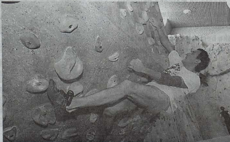
NUPeko rokodromoa azarotik itxita dago, segurtasun azterketa bat egiteko.

Iragan urtean Iruñerriko rokodromo publikoen inguruan zeuden aurreikuspen asko bertan behera gelditu dira. NUPekoa itxita dago, Atarrabiakoak ez da behar bezain ona, eta Arantzadiko proiektua ez dago oraindik zehazturik.