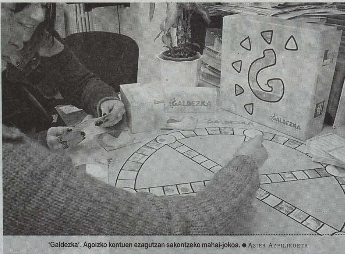
'Galdezka', Agoizko kontuen ezagutzan sakontzeko mahai-jokoa. ● ASIER AZPILIKUETA