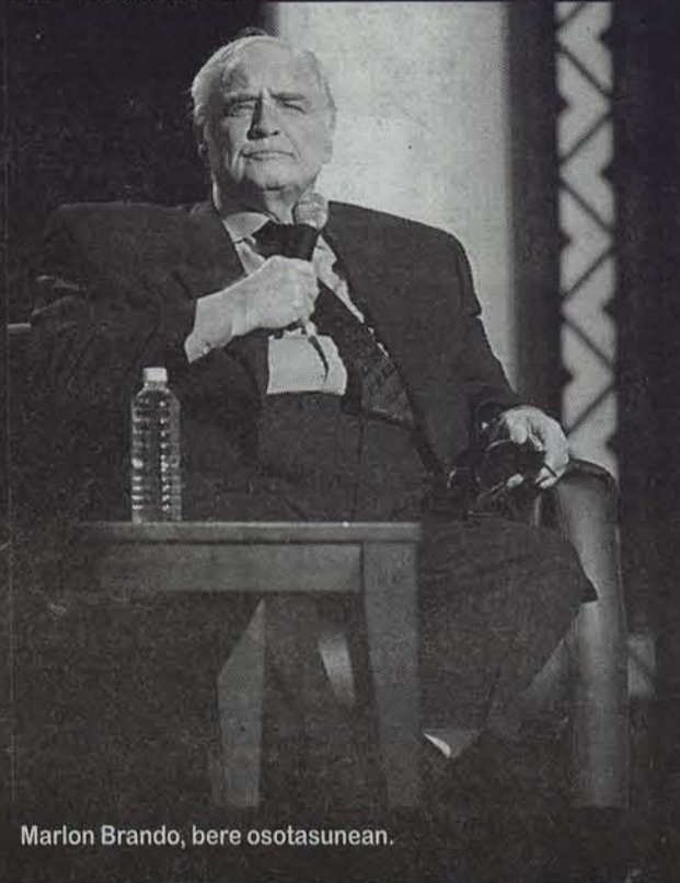
Marlon Brando, bere osotasunean.