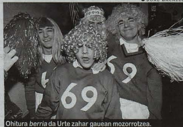
Ohitura berria da Urte zahar gauean mozorrotzea.

Horrek erran nahi du jendeak oraindik ez duela eskarmenturik hartu. Azken finean, burua mozorrotzearena kontu berria da hirian, baina iduri du bitziza osoan halaxe izan dela, eta hori 18 urteko gazteak bertzerik ez dezake erran. Beraz, duela gutxi arte, ez du bereizitasunik izan Iruñeko ospakizunak, ez bada garai batean egiten ziren gauerdiko meza jendetsuak, arrunt jendetsuak, XIX. mendetik XX.-ra pasatzerakoan gertatu zen moduan, jendea katedralean komekatzan egon baitzen goizeko laurak arte. Bekatuak aitortzeko ere ilara luze luzeak egin ziren. Izan ere, zer gerta ere, hobe zen mende berrian garbirik sartzea, iruindarrek sinistu egin baitzuten profeziek