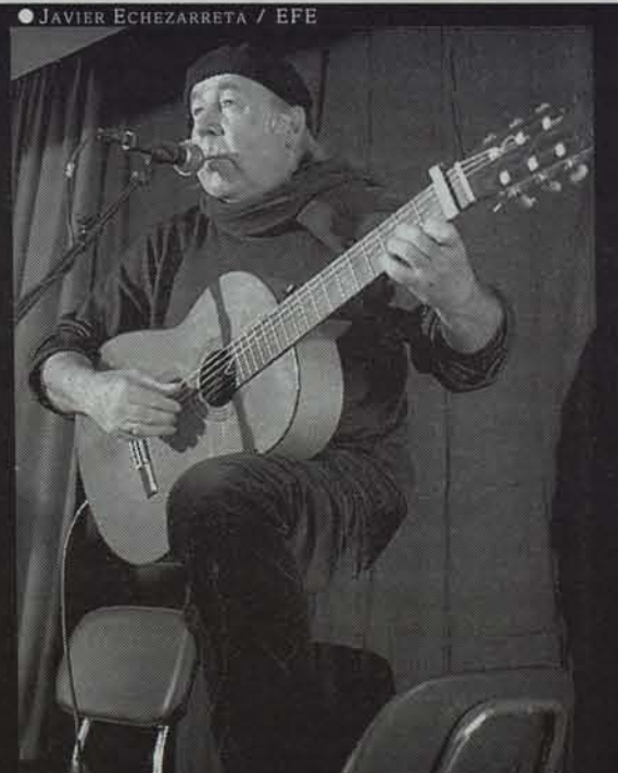
Mikel Laboa, gitarra jotzen ikasteko eredu.

gain, iruditu zitzaidan 23a izanda, jende guztia Eguberrietako erosketak egiten ariko zela. Eta hori guztia gutxi balitz bezala, hotz ikaragarria zen nagusi larunbat arratsaldean. Gauzak horrela, iruditu zitzaidan inor ez zela joanen manifestaldira, horixe izan zen neure golkorako egin nuen iragarpena: ez da inor joanen.