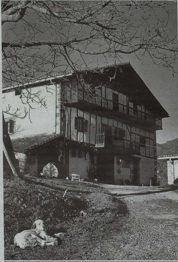
Ibilbidean Balkezenea eta antzeko beste zenbait baserri ikus daitezke, Dornaku auzoan.