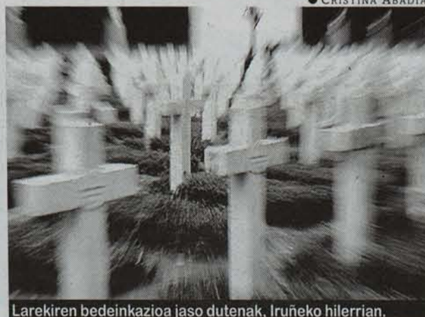
Larekiren bedeinkazioa jaso dutenak, Iruñeko hilerrian.

di eta mando bat paratu zituen, Beritxitoseraino joateko. Hori, jakina, sosik ez zutenendako. Hiriko aberatsek, ordea, bazuten euren gurdi dotorea, goiko aldean urrezko hariz bordatua, sei zaldi lepabeltz odol garbik tiratua, lehen mailako ehorzketak, alegia. Bigarren eta hirugarren mai-