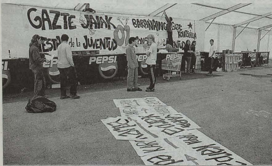
Gazte Jaiak Barañaingo hogei bat gazte taldeen artean antolatu dituzte.

Barañaingo hogei bat gazte talde, hainbat ideologia eta lan esparrutakoak, elkarrekin ari dira lanean Nafarroako lehen gazte kontseilu lokala osatu nahian. Elkarlan horren lehen fruitua egunotan ospatzen ari diren gazte jaiak dira.