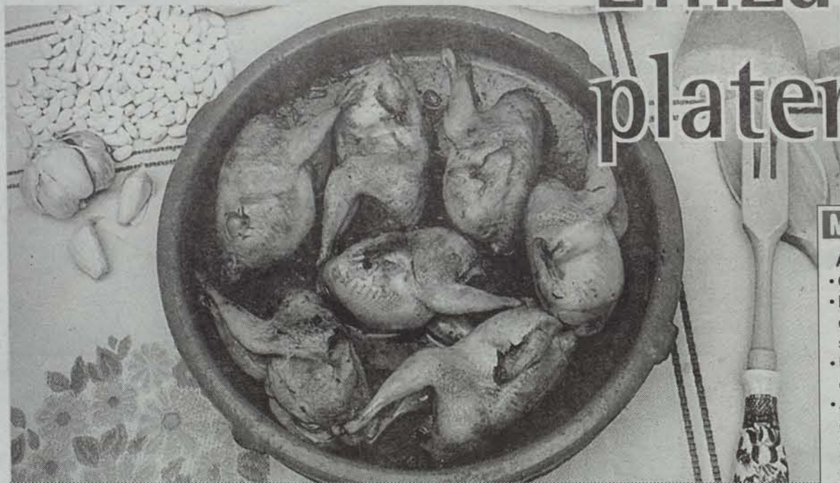
Eskualdeko hamaika jatetxek ehiza menu bereziak eskainiko dituzte azaroan. • EGUNKARIA

Hilabete osoan menu bereziak eskainiko dituzte eskualdeko jatetxeek