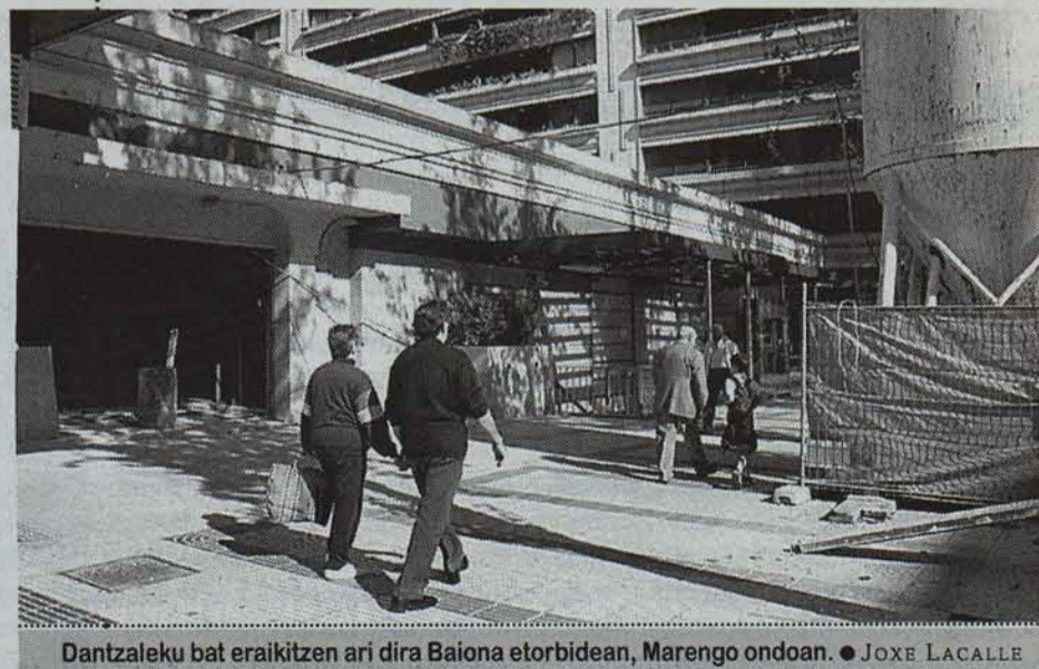
Dantzaleku bat eraikitzen ari dira Baiona etorbidean, Marengo ondoan. ● JOXE LACALLE

Irudi du ostalarien eta barrideen interesak uztartzea zaila dela. Arraizak ez du hori uste. «Ostalarien eta gure interesak bateragarriak dira guziz; ez, ordea, goizeko bostetatik aurrera negozioa zabaltu nahi duten ostalari horien interesak. Ordu