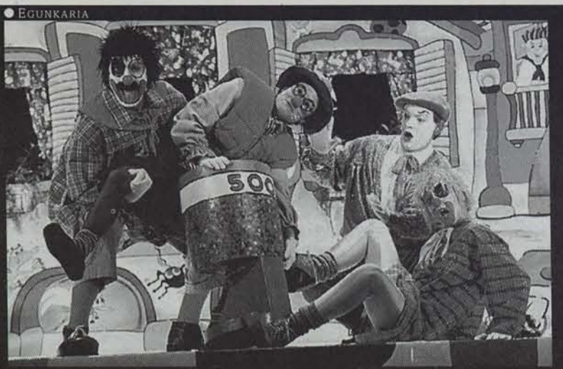
● EGUNKARIA Takolo, Pirritx eta Porrotx pailazoak.

tara, boston zirek eta jertseek lehertzearaino bete eta zamatu zuten aita familiakoaren motxila. Harrezkerotik emazteak lotzen dizkit zapatak, martirio horren ondotik nire bizkarra ez baita makurtzeko gai. Pare bat dozena orno txikituta dauzkadalakoan nago. Nolanahi ere, ziur naiz zirok eraman izan ez bagenitu zaparrada biblikoa pairatuko genuela.