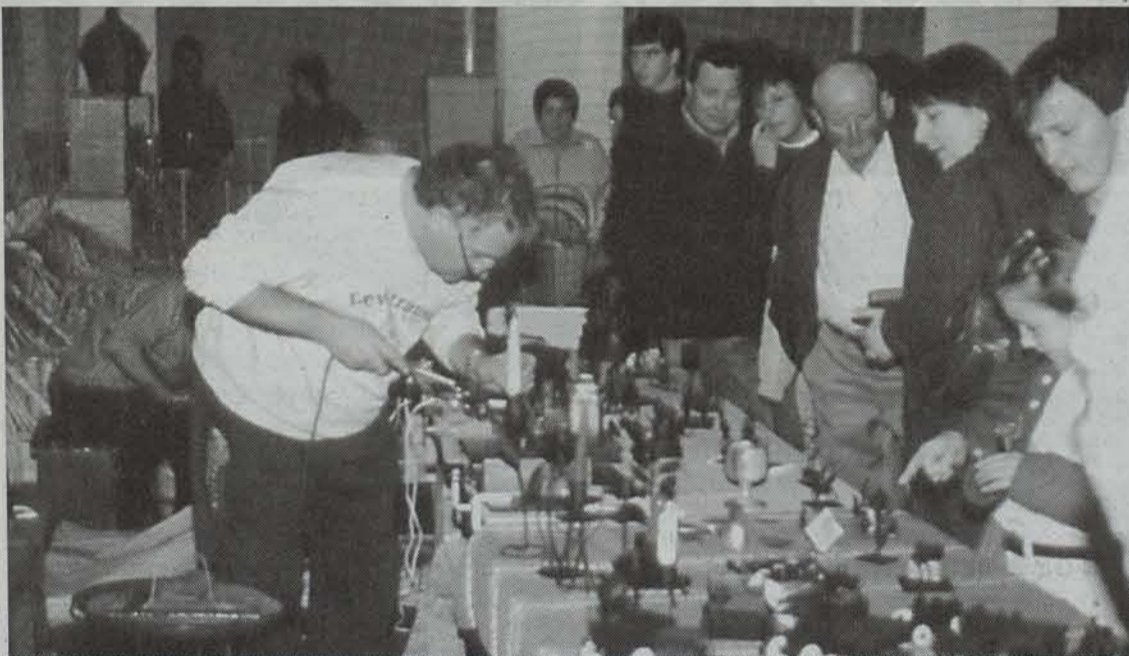
Ehun eskulangiletik goiti bilduko dira Beran igande honetan, Lurraren Egunean. ● TTIPI-TTAPA

Ehun artisautik goiti bilduko dira Beran igande honetan, egurra, zeramika, larrua, elikagaiak, burdina, ehunak, eta bertzelako eskulanak lantzen eta saltzen. Bertako baserriarrek eta eurek ekoiztutako produktuek leku berezia izanen dute XV. Lurraren Egunean.