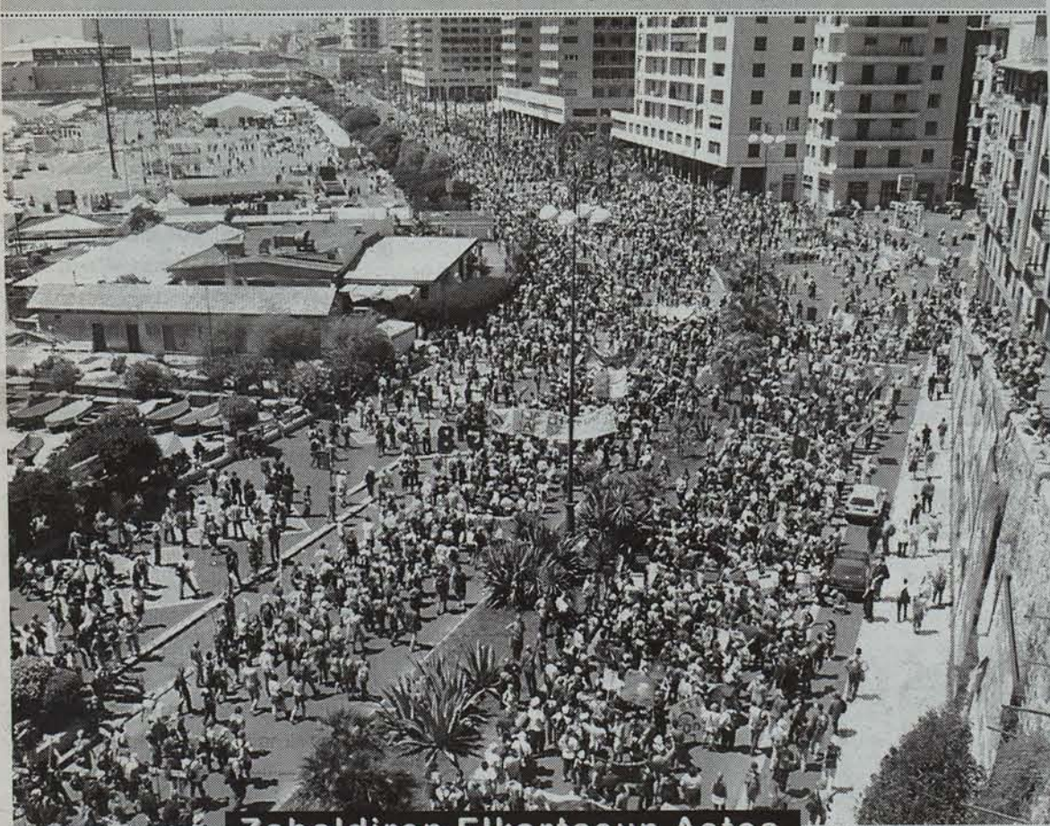
Zabaldiren Elkartasun Astea hitza emanen diete globalizazioaren aurka borrokatzen direnei. • EGUNKARIA