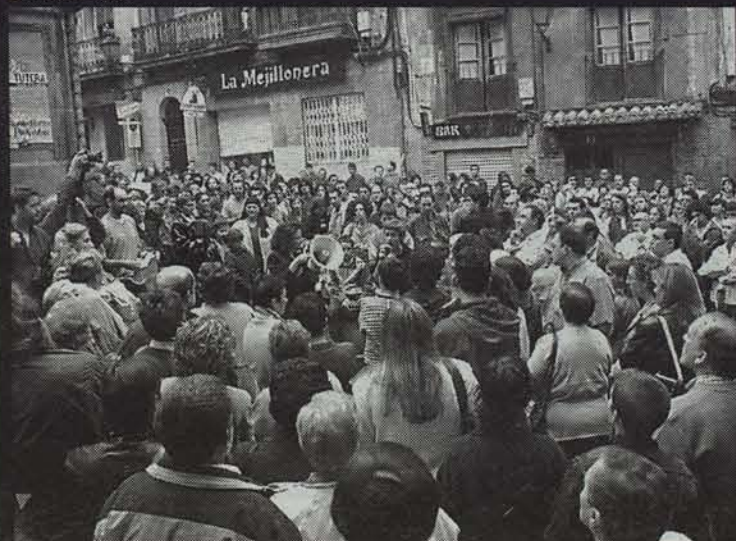
Nabarrerriako bizilagunak, Aldapako tabernariaren hilketaren aurka.