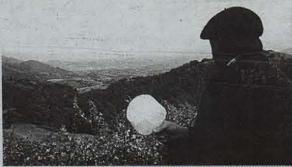
Usoak palen bidez jaitzarazten, Etxalarko usategi batean.

Inguruko herrietatik jende andana joanen da igandean Lizaietara oinez, ohitura izaten baita hori eskualdeko hainbetez jenderentzat. Azken aste honetan uso anitz pasatu