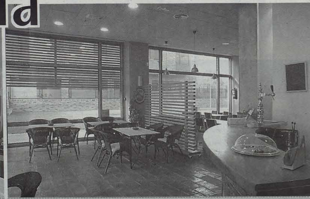
Hirixka ekozentroak, denda ez ezik, taberna eta jatetxea ere baditu.