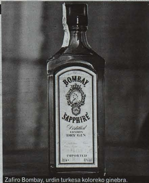
Zafiro Bombay, urdin turkesa koloreko ginebra.