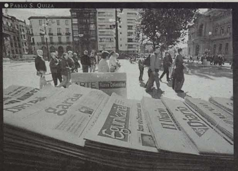
EGUNKARIA eta beste egunkariak, kioskoan.