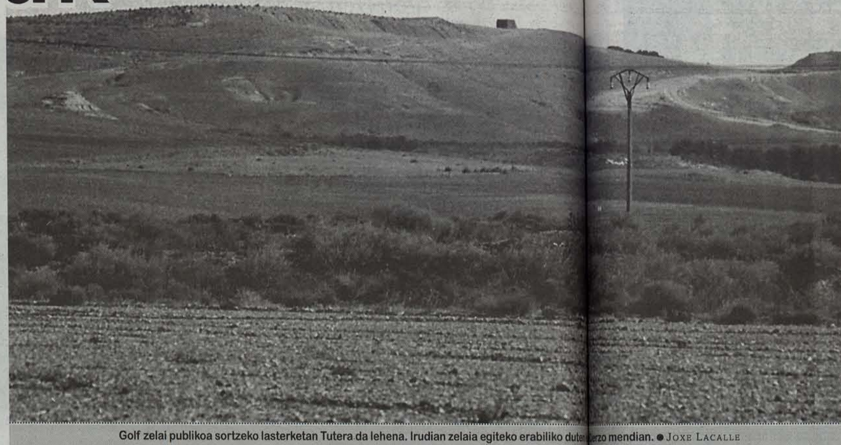
Golf zelai publikoaren lasterketa Tuteran da lehena. Irudian zelaiak egiteko erabiliko duten lurra erakusten da.

Han eta hemen, golf zelai publikoak sortu nahi ditu Nafarroako Gobernuak. Turismoa erakartzeko modu ona izan daitekeela uste baitu. Eta proposamena egin die udal guziei. Oraingoan, Ebro ibaiaren bazterreko bi herri agertu dute interes gehien. Tuteran eta Mendabian golf zelaiak sortzeko tramiteak arindu dituzte, eta baliteke 2003. urtearen hasieran golf zelaiak martxan izatea.