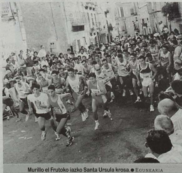
Murillo el Frutoko iazko Santa Ursula krosa.

Herrietako bestetan mota askotako ekitaldiak izaten dira, gehienak arimaren gozamenerako baina gorputzaren kalterako. Alta bada, Zizur Nagusian eta Murillo el Fruton kros bana antolatu dute.