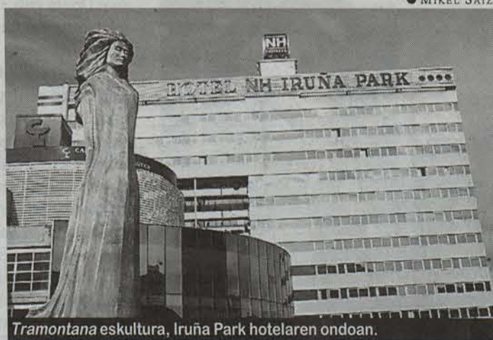
Tramontana eskultura, Iruña Park hotelaren ondoan.

2.800 lagunentzat dago tokia Iruñeko hoteletan. Jaietan bakarrik daude muku-