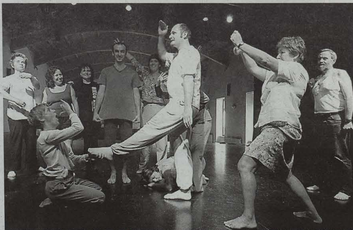
Antzerkia, hizkuntza, arte diziplinak eta ingurunea jorratzen ari dira egunotan ikastaro batean Beran. ● OSKAR MONTERO

Antzerkia, hizkuntza, arte diziplinak eta ingurunea jorratzen ari dira ikastaro batean