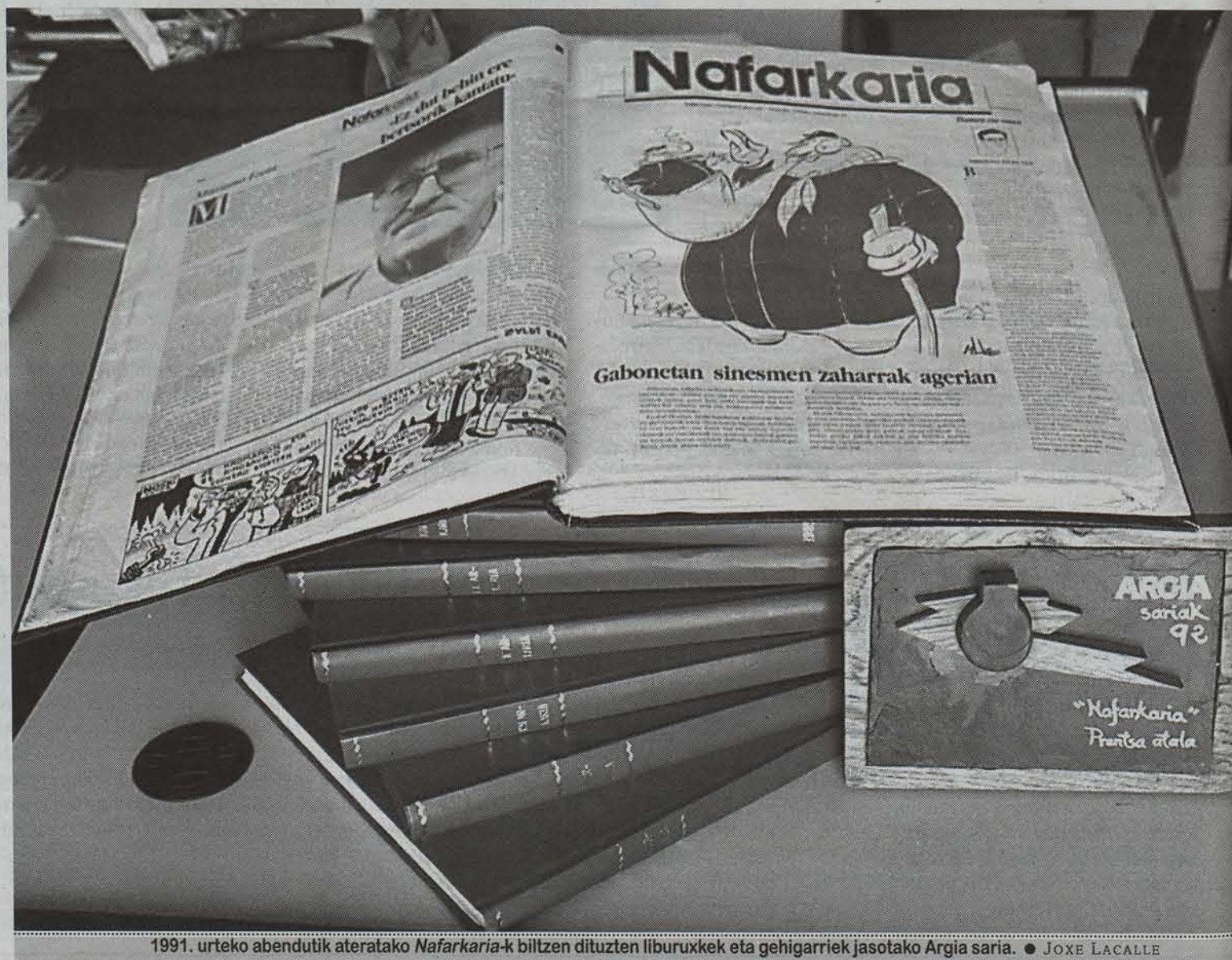
1991. urteko abendutik ateratako Nafarkaria -k biltzen dituzten liburuxkek eta gehigarriak jasotako Argia saria. ● JOXE LACALLE

Iragan asteko ostiralean (noiz, bestela), hedabideetan euskara sustatzeko diru laguntzen deialdiak argitaratu zuten Nafarroako Aldizkari Ofizialean. Espero genuen, baina horrek ez dio mingostasunik kendu. Nafarroako Gobernuak Hizkuntza Politikako zuzendari berriek, azken hilabeteetako «hizkuntza politikaren» ildoari jarraiki, diru laguntzen esparrutik kanpora utzi dute Nafarkaria . Eta, zorionak! Nafarkaria 500. zenbakiarekin ateratzen baita gaur.