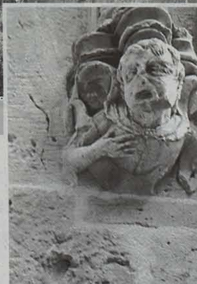
San Kristobal jauregiko atzealdea, ibai ondoan. Eta zaharberritzearen bi xehetasun. ● KRISTINA BERASAIN

koa da. Orotara hiru gorputz ditu palazioak, eta, barneko patioaz gain, eraikineko txokoe-tan ederki zizelkatutako zutabeak, kapitelak eta ateburuak ikus daitezke. Aurrealdean ere Kris-