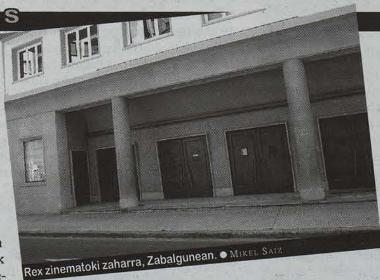
Rex zinematoki zaharra, Zabalguenean. ● MIKEL SAIZ

Horren ondoren, beste zenbait zine areto itxi egin zituzten: Arrosadian Guel-