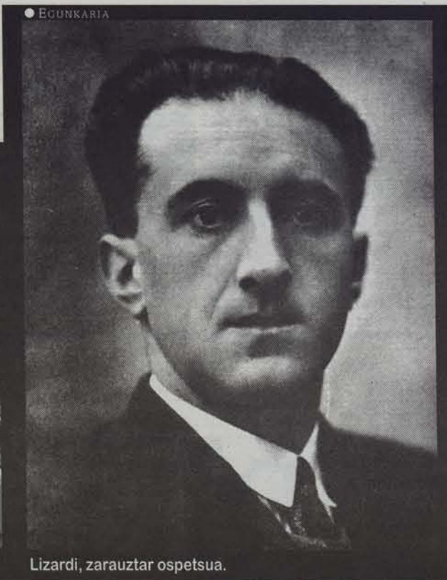
Lizardi, zarauztar ospetsua.