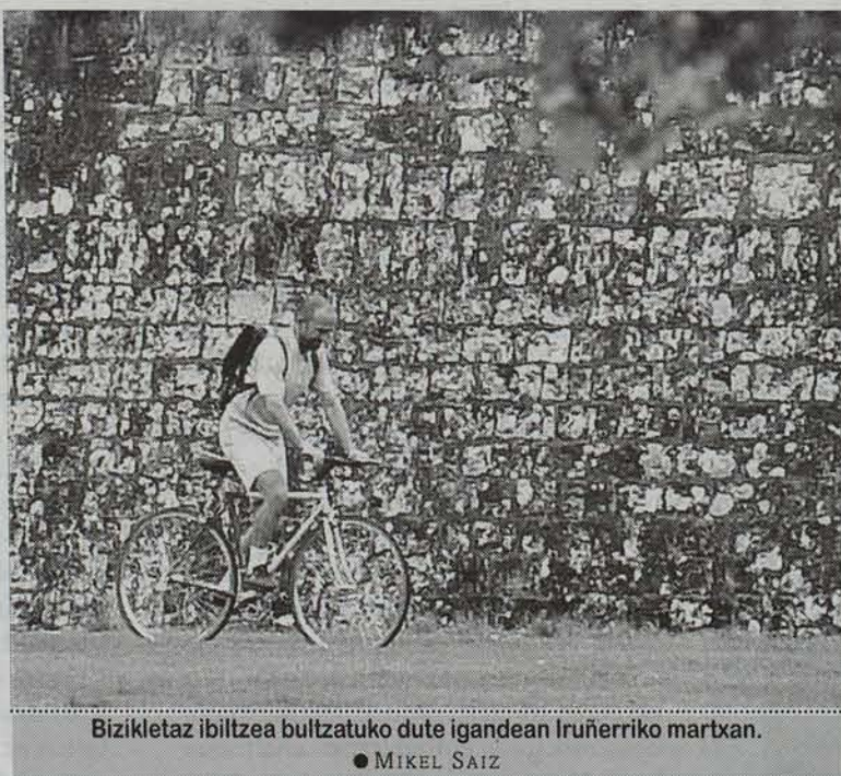
Bizikletaz ibiltzea bultzatuko dute igandean Iruñerriko martxan. ● MIKEL SAIZ

Martxaren %15a bidezidorretatik joanen da, %70a pistetatik