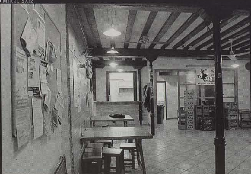
Zaldiko Maldiko, Iruñeko euskaldunen topagunea.