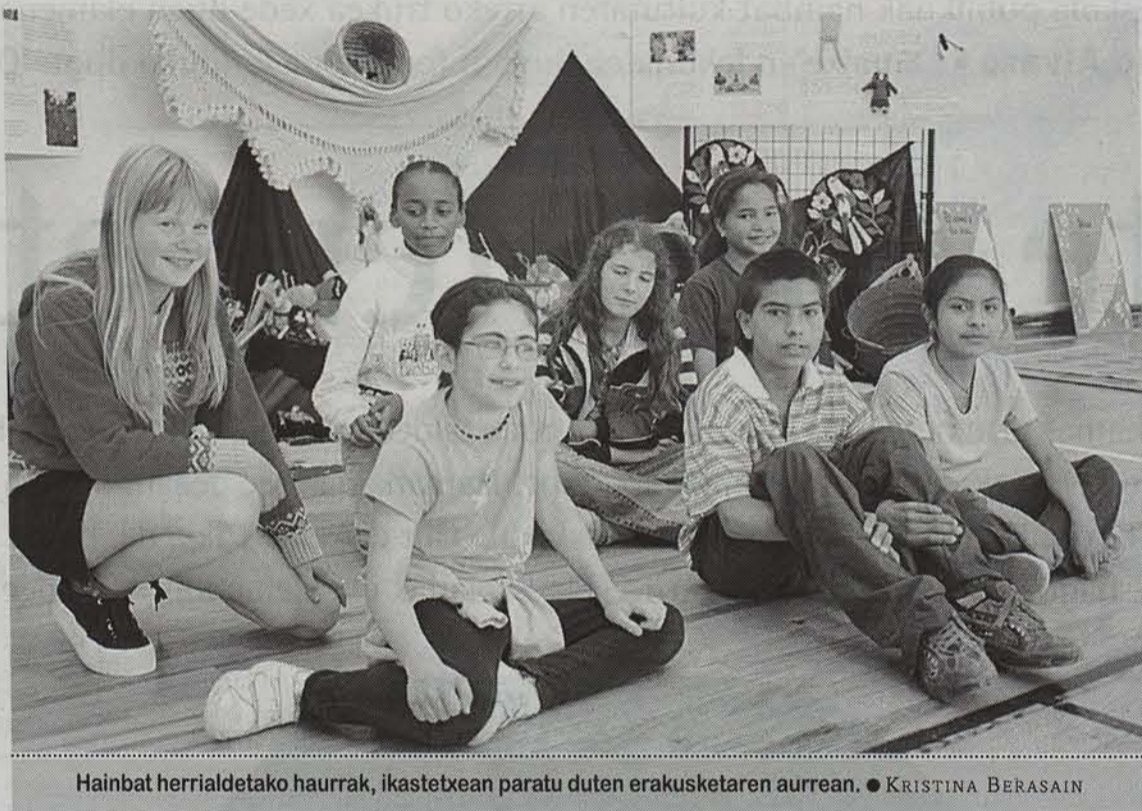
Hainbat herrialdeetako haurrak, ikastetxean paratu duten erakusketaren aurrean. ● KRISTINA BERASAIN

Ikastetxean egun dagoen kultur aniztasunaren adierazgarri gisa, Remontival eskola publikoak Kulturen Astea ekimena prestatu du estreinakoz, herrialdeen arteko trukea eta bizikidetzaz sustatzeko xedearekin.