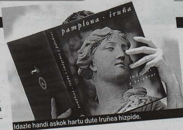
Idazle handi askok hartu dute Iruñea hizpide.