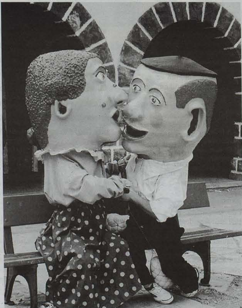
Cotilla eta Piripi Txantreako kilikiak asteburuan ere izanen dira auzoko karriketan ume koskorak zirikatzen. • EGUNKARIA •

Gaur hasi eta hurrengo asteartea arte, Txantreako auzoa jai giro alaian murgilduko da, inoiz baino luzeagoak izanen diren jaiak ospatzeko asmoarekin. Karriketan kilikiak, musikariak, dantzariak eta abar eta abar ibiliko dira bertako eta kanpokoen gozagarri.