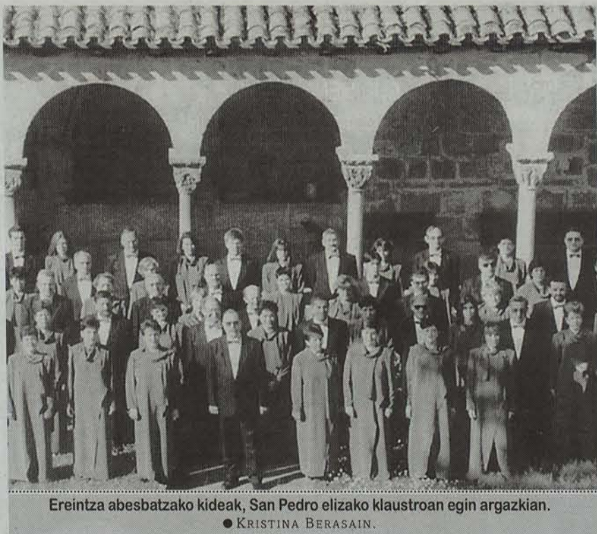
Ereintza abesbatzako kideak, San Pedro elizako klaustroan egin argazkian.