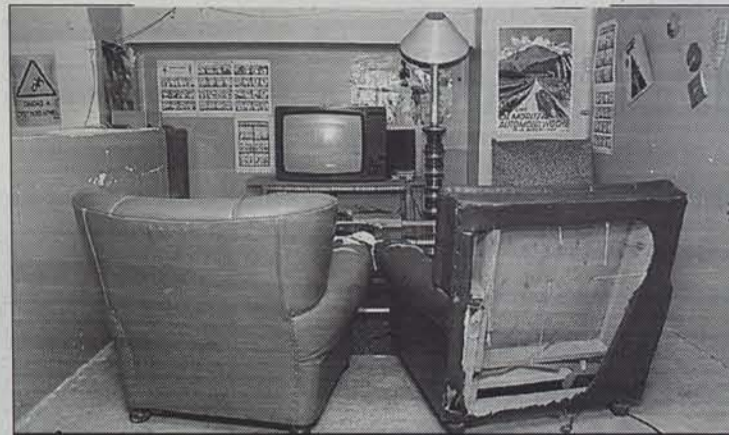
Iruñeko hainbat gaztek etxabeak alokatzen dituzte. ● CRISTINA BERIAIN