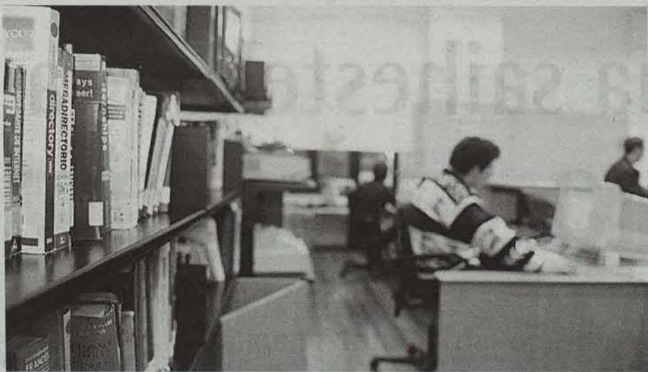
Udalaren gazteentzako literatura lehiaketan euskaraz parte hartzeko deia egin dute. ● GARI GARAIALDE

Idazlanak maiatzaren 5eko ordu biak baino lehen aurkeztu behar dira Gazteentzako Argibide Bulegoan, Gazteriaren Etxean (Zangoza kalea, 30). Narrazio laburraren sailean, gutienez hiru eta gehienez hamar orrialde izanen dituzte lanek; olerkikoan, berriz, gutienez poema bat aurkeztu behar da, 14 ber-