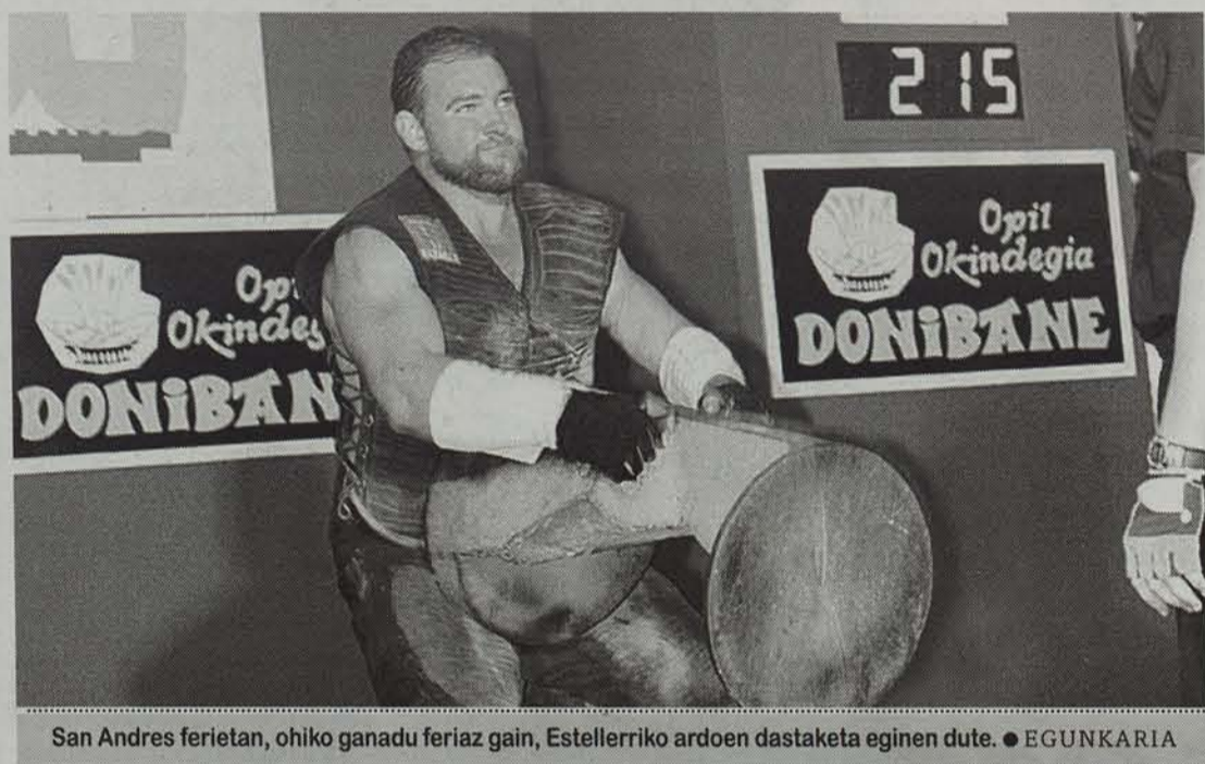
San Andres ferietan, ohiko ganadu feriaz gain, Estellerriko ardoen dastaketa eginen dute. ● EGUNKARIA

Sarako, Bermeoko eta Leitzako euskaltzaleak Perurenak ezarri nahi duen markaren lekuko izanen dira