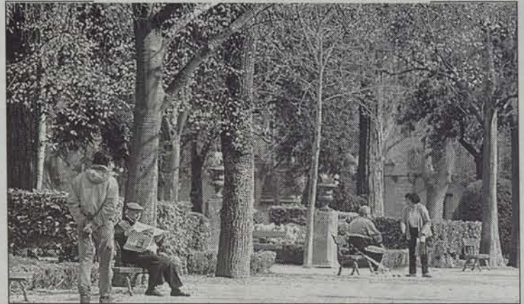
Takonera parkean landare exotikoak eta bertakoak biltzen dira. • MIKEL SAIZ