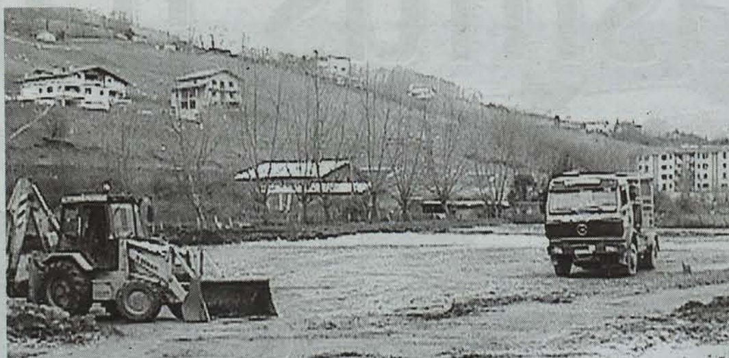
Zambra aretoa ireki asmo dute Lesaka inguruan. Goiko argazkian aretoa eraikitzeko lanak. Ezkerrean, aldiz, areto berria iragartzen duen kartela.

Urte amaierarako amaitua behar duen proiektu honek soka luzea du, hala ere. Lesakako herrian behin eta berriz zabaldu izan da aretoa eraikiko zuten zurrumuru, eta baimen guztiak aspalditik zituzten. Bertzelako arazo batzuek tarteko, hala ere, hasiera data bultzatzaileek nahi baino gehiago gibelatu da. Oraingoan, hala ere, lur mugimenduekin baino ez dira hasi, eta datozen asteetan dago aurreikusia eraikinaren oinarriak eraikitzen hastea. Inguruko errepideetatik sarbide berriak ere eraikiko dira, gaur egungoak bertako baserrietarako pista tikiak baitira. Errepideetik zuzenean sartu ahal izanen da aparkalekura. Nolako egitaraua osatuko duten, horixe da herritarren jakin-minik handiena orain.