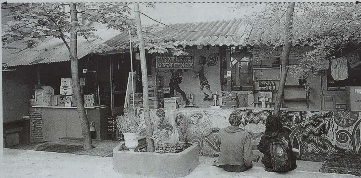
Iruñerriko hamahiru auzo eta herrietako gazte batzarrek antolatuta, bihar Gazte Eguna egingen dute Iruñeko Euskal Jai gaztetxean. • MIKEL SAIZ

Iruñerriko auzo eta herrietako hamahiru gazte taldek Iruñerriko Gazte Asanblada (IGA) berpiztu dute azken asteotan. Eratze batzarren ostean, lehen ekitaldi bateratua biharko Gazte Eguna izanen da.