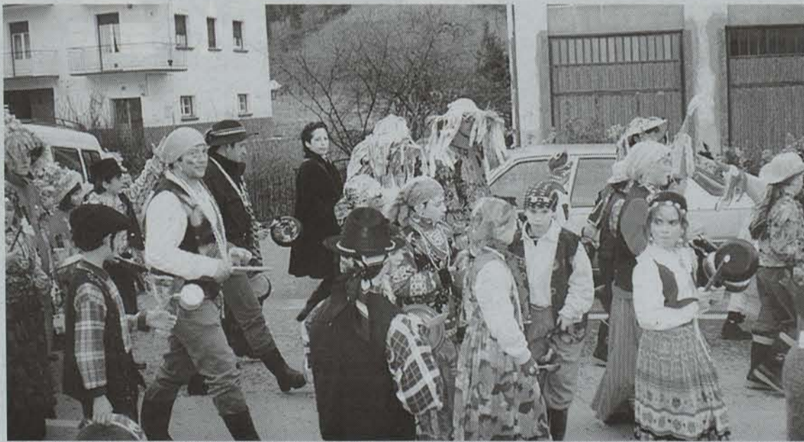
Inauteri garaia da Leitza, bihartik astearte arte. Igandean, organ desfilea egingen dute. ● EGUNKARIA