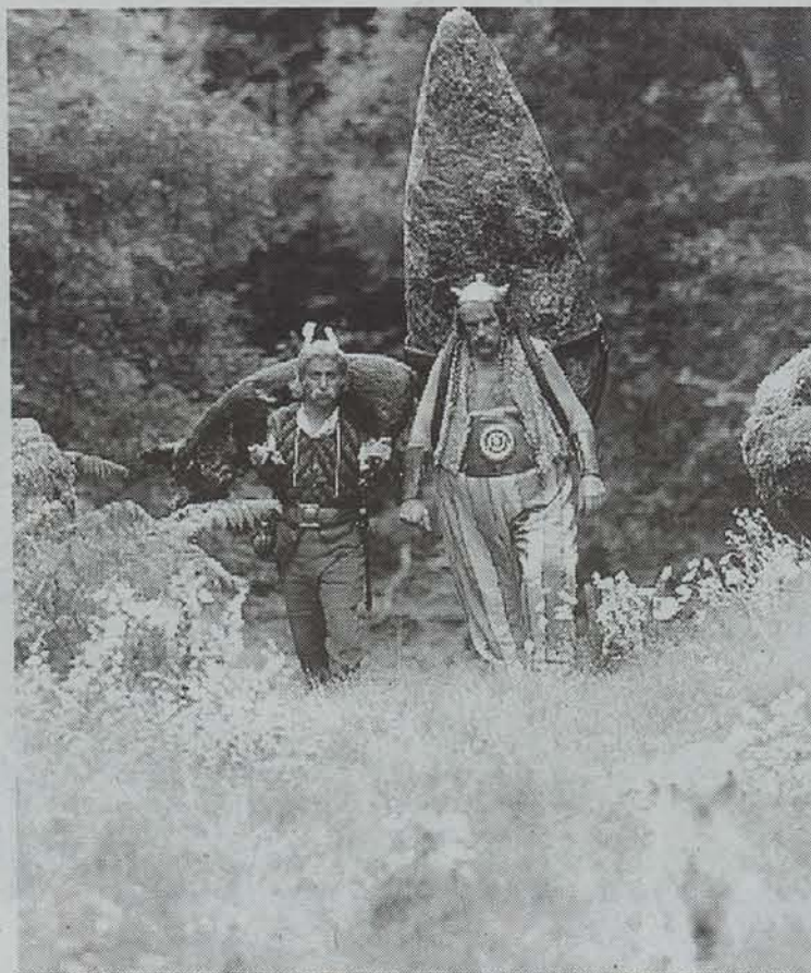
Karrikiriren zinemaldiaren baitan, gaur Asterix eta Obelix, Zesarren aurka filma pantailaratuko dute

Beste gauza batzuekin ere ez nengoen batere konforme. Esate baterako, errendizioaren kontuarekin. Gauza jakina da nola, zurien kontrako gudueta zebiltzala, zaharrek beti errendizioaren alde egiten zuten eta gazte odolbero eta gatatzatsuen kontra. Nik beti gazte odolberoaren alde egiten nuen!, eta "hemendik aurrera ez naiz gehiago borrokatuko" eta horrelakoak irakurtzerakoan izugarri gogogabetzen nintzen. Eta azken orrian ituna sinatzen zutenean nazka-nazka eginda bukatzen nuen: "Diosss!, beste gudu bat galdua!". Ez dakit esan dudana, baina oso gazte nintzen. Orain, atzera begira, borroka armatuetan ematen den errendizioari beste modu batez begiratzen diot. Crazy Horse bera ere (tasunké witko, lakoten artean gudari eta gidaririk handiena) errenditu baitzen. "Herriak bizi behar du!" leloarekin eraso egiten zuen herri batek lelo berarekin amore ematea jakin behar duela iruditzen zait orain. Borroka armatuari mugatutako amore emateaz ari naiz. Herria bizi den heinean erabateko errendizioa ez baita sekula ematen ahal. ●