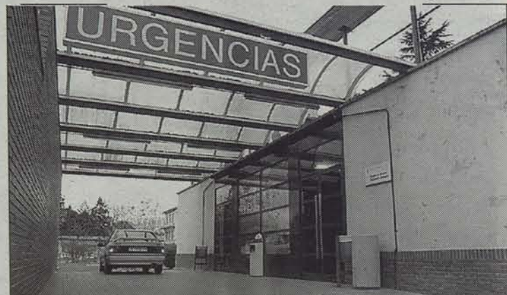
Laurehun lagunek jotzen dute larrialdietara egunero. • MIKEL SAIZ