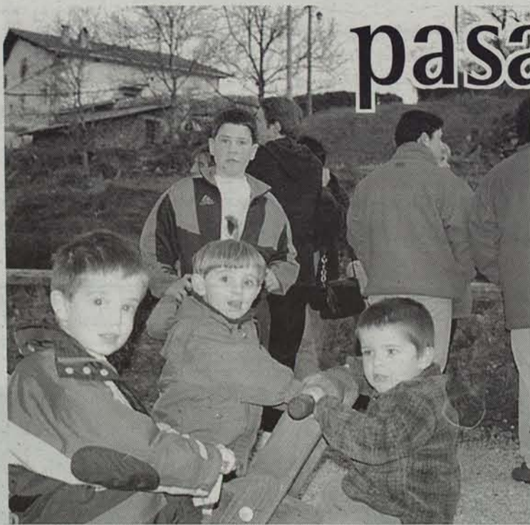
Aresoko txikienak eta gaztetxoek izanen dira protagonista gaurko Euskararen Egunean. • ELI BELAUNTZARAN

Goizeko 11:30ean hasiko dira Aresoko VIII. Euskaren Eguneko ekitaldiak. Guraso Elkartekoek egun osorako antolatutako ekitaldietan herriko txikienak eta gaztetxoek izanen dira protagonista nagusiak.