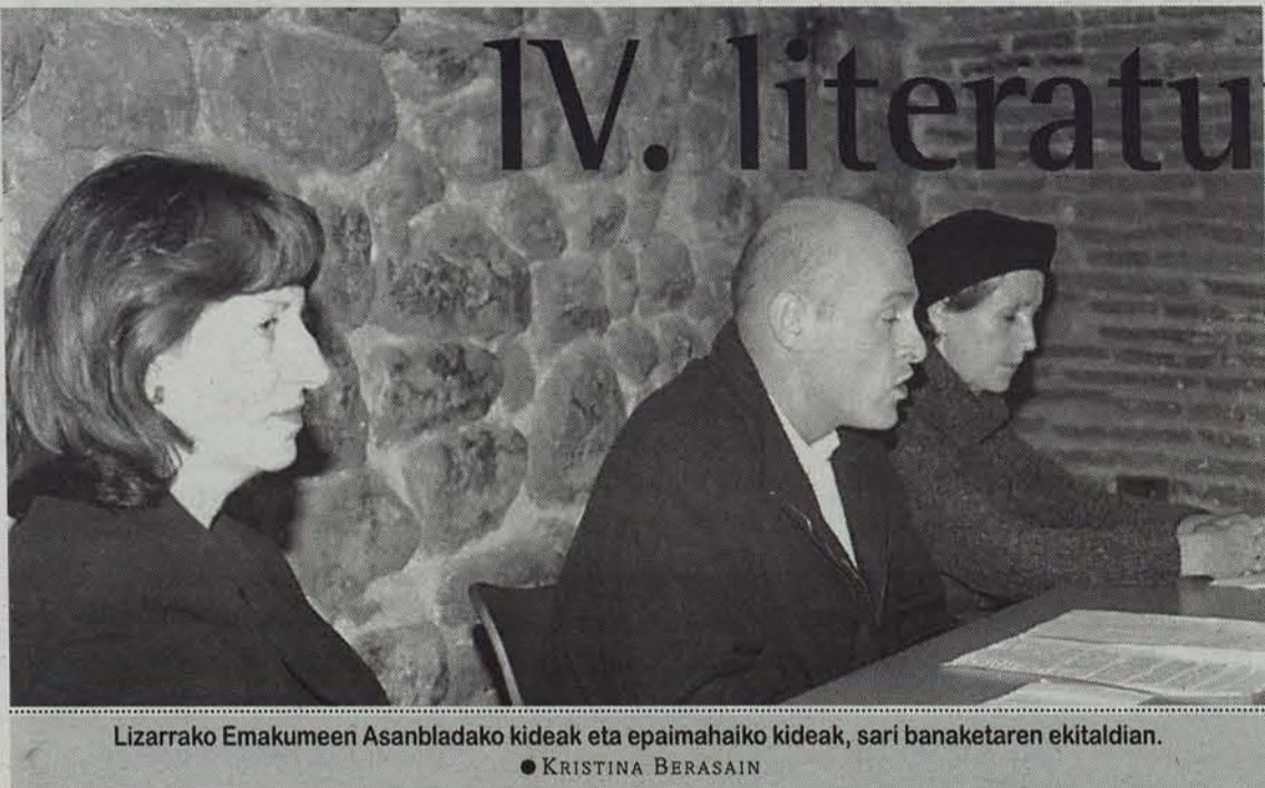
Lizarrako Emakumeen Asanbladako kideak eta epaimahaiko kideak, sari banaketaren ekitaldian. ● KRISTINA BERASAIN