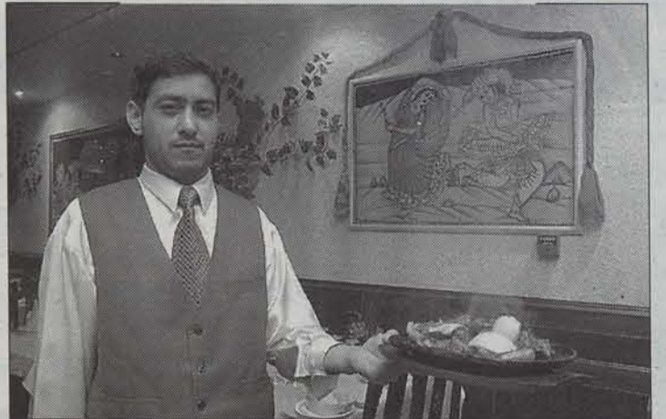
Urrutiko zaporeak dastatzeko aukera eskaintzen du Iruñeak.