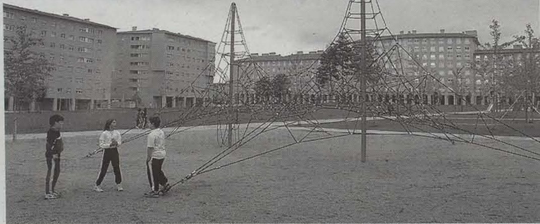
Arrotxapeako Euskararen Eguneko ekitaldi gehienak Gages parkean izanen dira. ● MIKEL SAIZ