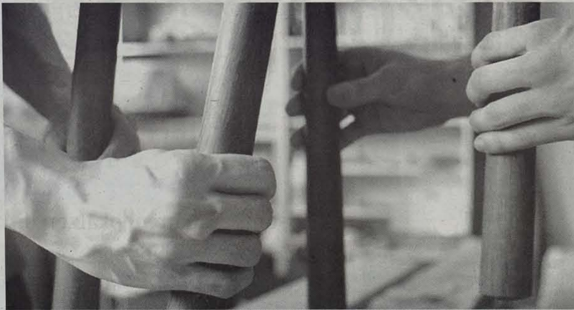
Jo Ala Jo elkarteak txalaparta jotzen ikasi zuten, eta, hortik abiatuta, sagardoa egiteko antzinako moduan beste perkusio tresna bat aurkitu zuten, kirikoketa. ● GARI GARAIALDE