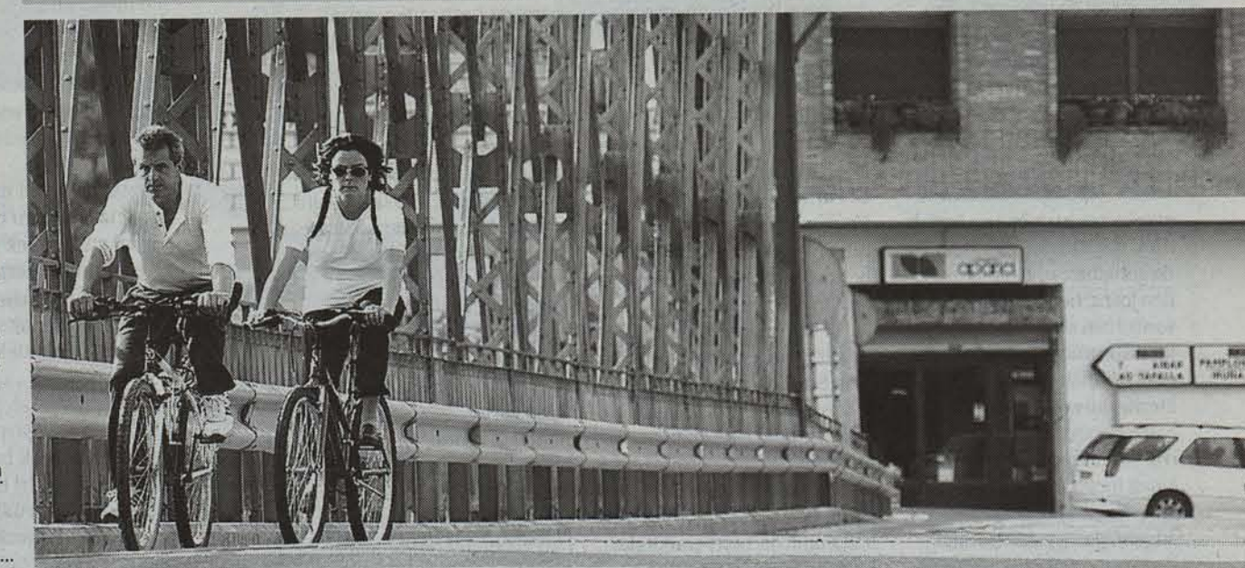
→ Asier Azpilikueta