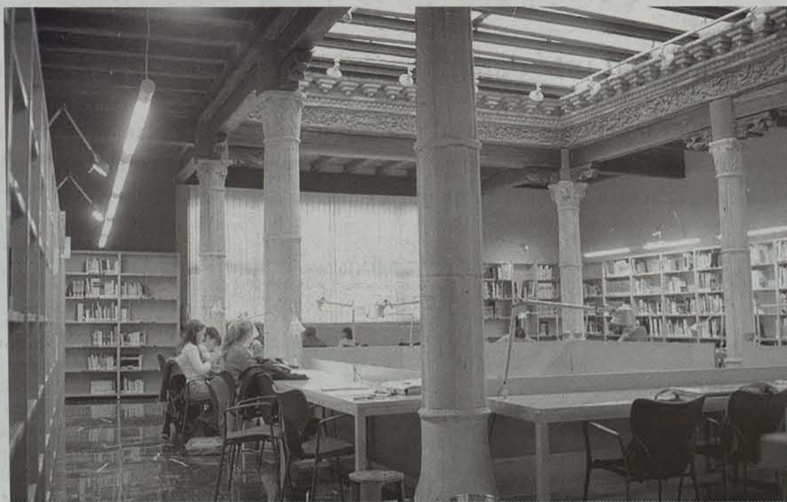
Ireki berria duten Jose Maria Lacarra herri liburutegiak XVI. mendeko Egiatarren jauregian du egoitza.