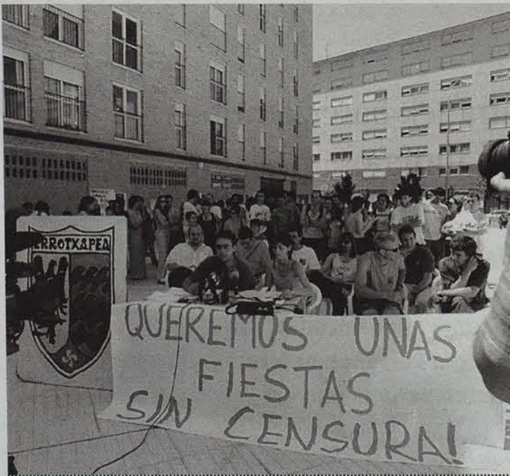
Ekainean jaiak bertan behera utzi behar izan zituzten Udalak jarritako oztopoak zirela eta. Bihar, erebanta hartuko dute. • IÑAKI VERGARA

Ekainean auzoko jaiak ospatzeko Iruñeko Udalak oztopoak jarri ondoren, bertan behera utzi behar izan zituen Arrotxapeko Jai Batzordeak. Bizilagunek bat egin zuten eskakizunetan, eta orain ospakizun berezia prestatu dute.