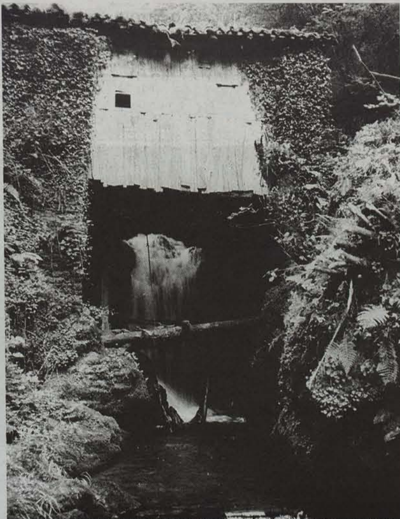
Horrelakoa izan da Infernuko Errota antzinetik; orain eraberritu eta bisitari askoren helmuga da. ● ZALDUA

Zenbait jabeen gogoari esker honelako gero eta errota gehiago berreskuratzen ari dira. Honelako eraikuntza guztien artean bereziena ziurrenik infernuko errota da etxolaren azpitik infernuko erreka pasatzen baita.