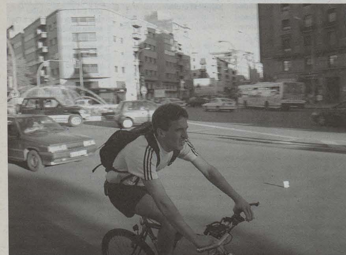
Iruñeko kale askotan eta ordu batzuetan oso arriskutsua da bizikletaz ibiltzea. ● IÑAKI VERGARA