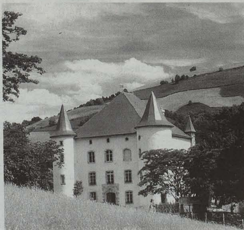
Baigorriko Etxauz jauregia, Erdi Arokoa, garai batean Nafarroako errege-erreginen leinuarekin harreman estua izan zuen.

Nafarroako bizimodua eta ohiturak izeneko erakusketa ikusgai dago Baigorriko Etxauz jauregian. Tresna eta irudien bidez, garai bateko etxea, ospakizun eta lanbideak nolakoak ziren ezagutu daiteke.