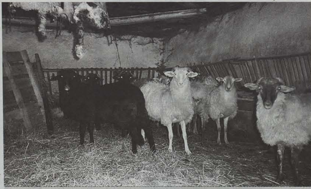
Asteartean, urteroko artzain txakurren txapelketa ez ezik, Baztan, Urdazubi eta Zugarramurdiko behi eta ardi azienden sariketa ere egingen dute Amaiurren. ●RAKEL GOÑI

Amaiurko herritarrek lan ederra egin dute aurtengo bestak antolatzeko. Urtero antolatzen duten artzain txakurren txapelketaren 25. urteurrena betetzen dela eta, ekitaldi berezia antolatzea erabaki dute: behi eta ardi azienden sariketa.