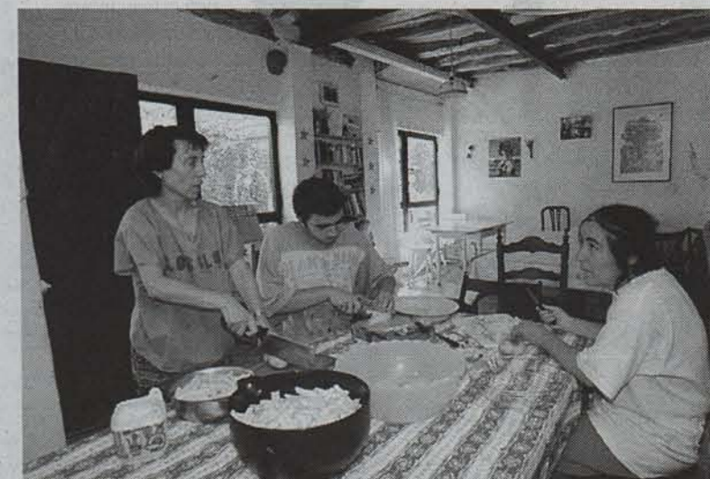
La Fresquera etxean bezeroek parte hartzen dute etxeko zereginetan. Konpartitzea da etxe horretako funtsa.