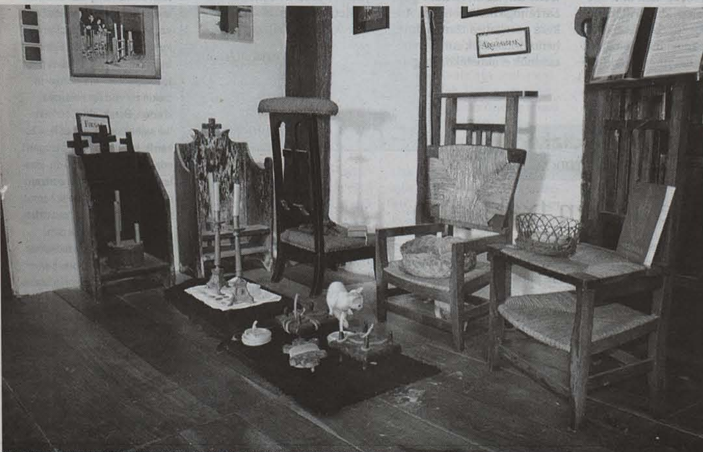
Garai batean, hiletetan sekulako garrantzia zuten argizariok. Bere izenak dioten bezala, argizaria duten oholak dira, hilak lurperatu bitartean pizturik eduki beharrekoak. INAKI VERGARA