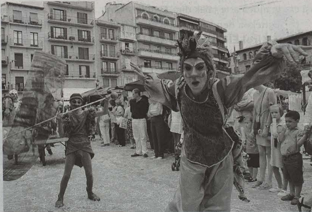
Hirugarren urtez egin da jarraian Lizarran Erdi Aroko astea. • INAKI VERGARA

Hirugarren urtez jarraian, Lizarran Erdi Aroko Astea egin berri da. Garai hori aztergai duen ikerketa astearen harira, hiri osoa barneratzen da astebetex X. eta XV. Mendeen arteko bizimoduan.