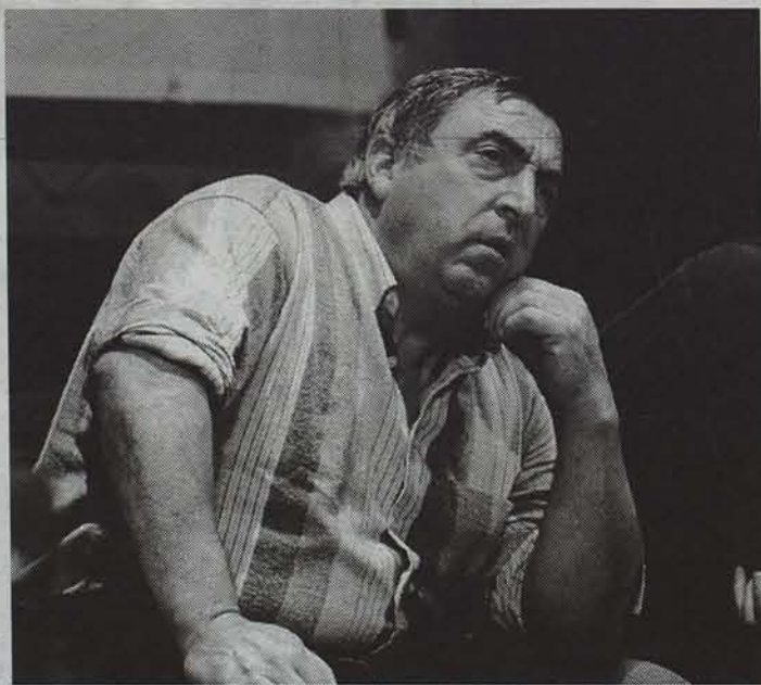
Mañukorta izanen da gaurko herri afarian arituko den bertsolarietako bat. Berarekin batera, Zeberio izanen da. ● EGUNKARIA

25en bat urte jaiotzarik gabe izan ostean, aurten ume bat jaio da Astitzen, eta hori ospatzekoa da alajaina. Hori, eta gaur hango festak hasiko direla. Musika, txokolatea eta kirol frogak ez dira faltako hiru eguneko parrandan.