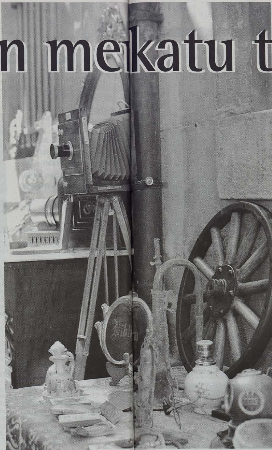
II. Mundu Gerrako maskarak, azpilak, hauspoak, presio lapikoak, pitxerak, xehagailuak, lisaburdinak, aitzurrak, eskiak, aurpegirik gabeko Kristoa, «Esparragos Muerza» dioen kristalezko publizitate kartela, egurrezko golf makilak, elizako limosna kutxa... Edozein tresna zahar eta bitxi dago salgai Arkakuso Onen azokan.