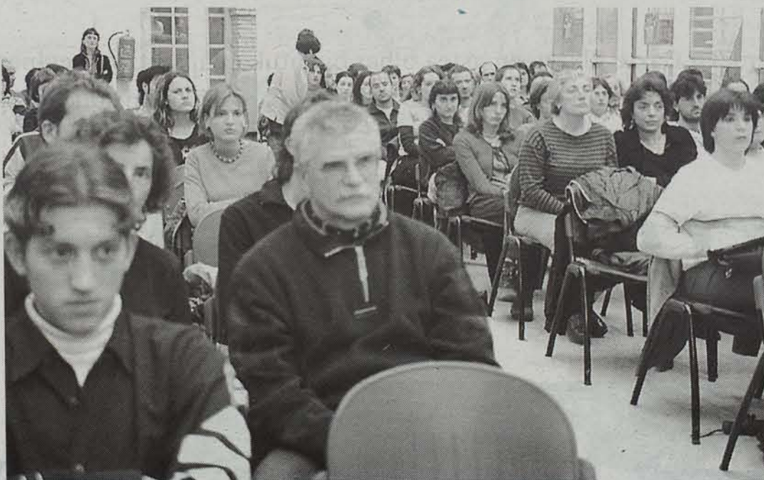
Gazte Elkarteek Asteak makina bat gazte (eta horren gazte ez direnak) erakarri ditu ekitaldietara.

Gazte elkarteek urte osoan egiten duten lana erakutsi eta gazteei interesatzen zaizkien gaien inguruan hitz egitearren, Nafarroako Gazte Kontseiluak astebeteko jardunaldiak egin ditu.