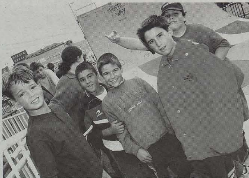
Altsasuko 12 eta 17 urte arteko gaztetxoak biltzeko toki bat antolatzeke xedea dute.

Gazte talde bat Gaztelekua sortzekotan da herrian dagoen premia ikusita. Egitasmoaren berri emateko, gaur bilera egiteko deia egin dute.