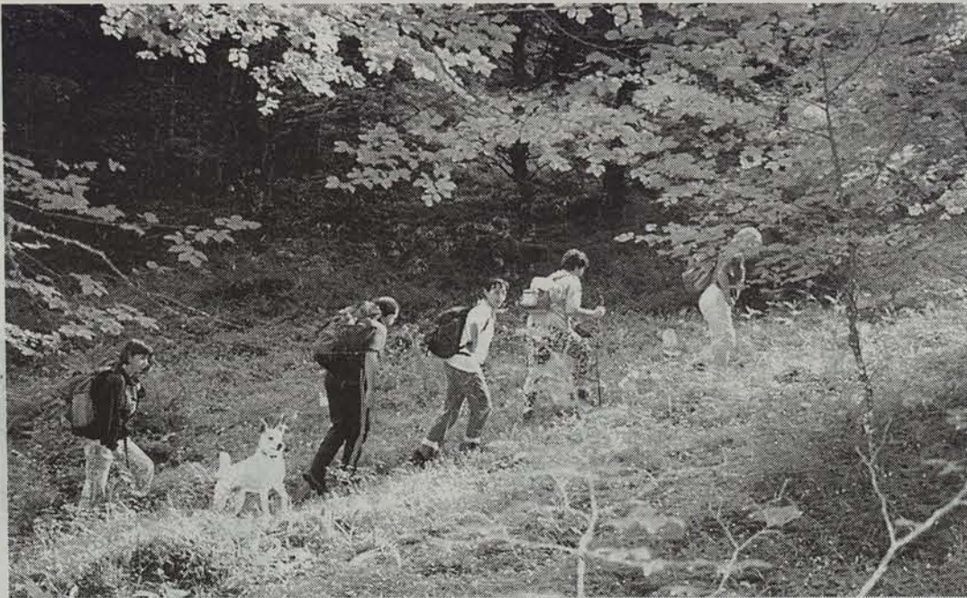
Baztango zuhaitzi ederretan barrena ibiltzeko aukera izango dute mendizaleek ● EGUNKARIA

Berroetan hasi eta Berroetan bertan amaituko da Baztango Mendigoizaleek antolaturiko VII. Mendi Ibilaldia, maiatzaren 21ean. Goizean goiz abiatuko da, Baztango herri, mendi eta txoko anitz ezagutu ahal izateko.