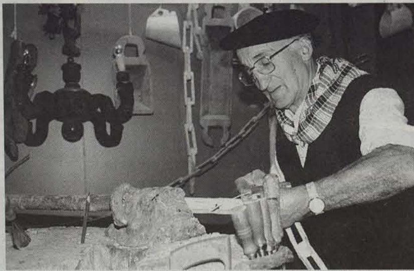
Baztango eskulangile gehientsuenak bilduko dira gaurko ferian. ● EGUNKARIA

Urtero bezala, udaberriko feria egingen da gaur Elizondon. Inguruko eskulangileak bilduko dira euren produktuak agertu eta saltzeko. Merkatuko Plazan, aziendak egonen dira ikusgai.