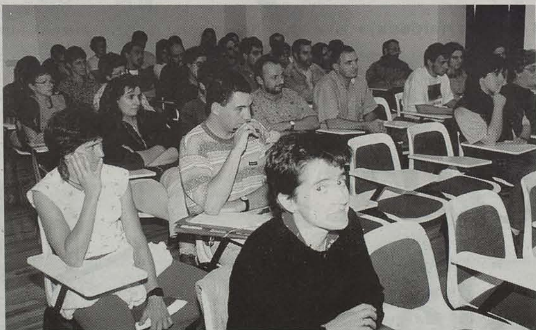
Baztan-Bidasoako Euskaltzaleen II. Topaketa Doneztebeko Juansenea etxean egingen da. ● TTIPI-TTAPA

Baztan, Malerreka eta Bortzirietako euskara zerbitzuek antolatuta, Baztan-Bidasoako Euskaltzaleen II. Topaketak egingen dira maiatzaren 3tik 17ra, astelehen eta asteazkenetan. Euskaltzaleak elkartzearekin batera, euskalgintza eta euskara bera aztertuko dira bortz emanalditan.