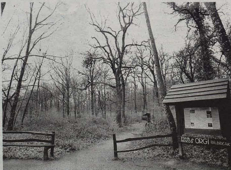
Orgiko parkeak ONCEekin sinatuko duen hitzarmenari esker, itsuek parkearen xarmaz jabetzeko aukera izanen dute. CRISTINA BERTAIN

Lizasoko Kontzejuak eta Ingurugiro Sailak kudeatzen duten Orgi hariztiko parkeak ONCE erakundearekin hitzarmena sinatuko du. Parke horrek Ultzamaldeko bidexkak lehengoratzeko proiektua ere egin du.