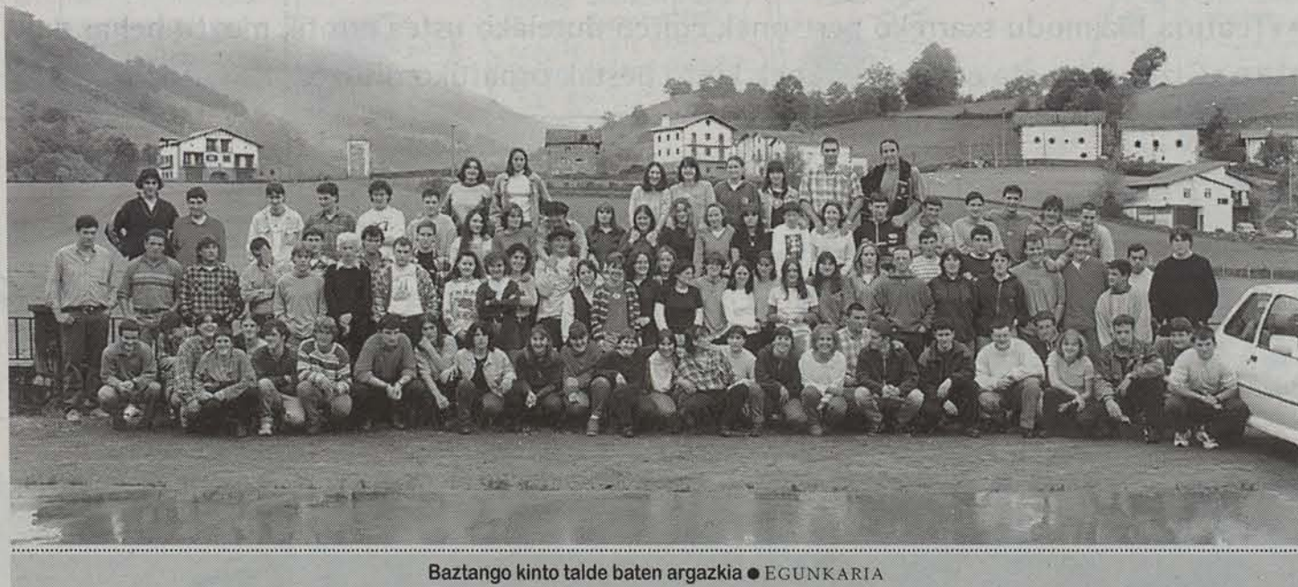
Baztango kinto talde baten argazkia ● EGUNKARIA

21 urterekin hasten dira gazteak kinto bestak ospatzen