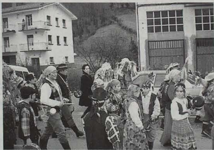
Kauteroen desfilea ikusi daiteke gaur Lizarran. ● ELI BELAUNTZARAN

Bigarren urtez jarraian, La Bota elkarteak Kauteroen Eguna antolatu du inauterien atariko gisa. Bihar arratseko seietatik aitzina iluntze arteraino, Lizarrako karrikak jai kolorez eta musikaz jantziko dira.