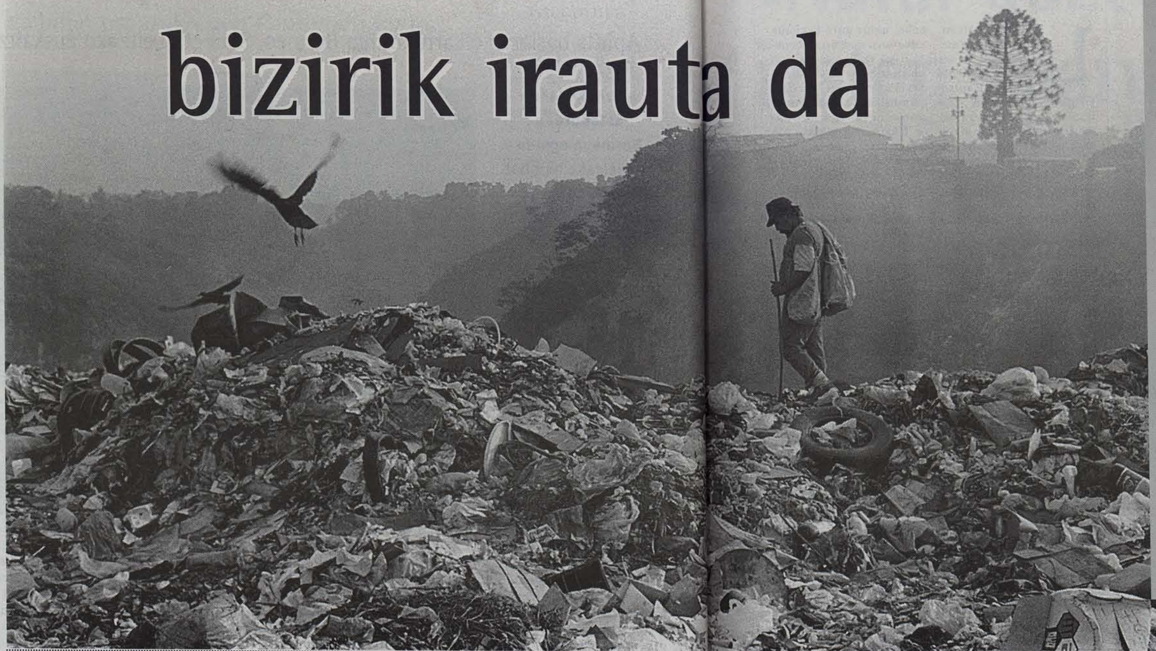
Hiri- ragin dituzten, Giriko zabortegian guzia eta ogeri da leku hazterria

ren barrutian. Mende hasieran hasi ziren zaborra botatzen hiri ondoko sakan batean. Baina lehen alboan zegoena orain erdian dago. Guatemala hiria izugarri handitu da. Mende hasieran 200.000 bizilagun zituen, eta orain hiru milioi eta erdi. Zabortegia 1952an ofizialdu zen, nolabait errateko. Orduan hirurehun bat lagun hasi ziren guajeatzen , hau da, zabortegitik gauzak hartu eta azokan saltzen.