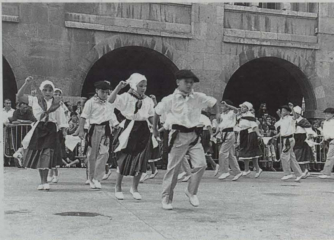
Euskararen normalizazioaren aldeko apostua egin nahi dute Bermeo (Bizkaia), Sara (Lapurdi) eta Leitzaoko (Nafarroa) euskaltzaleek. ● EGUNKARIA

Apirileko lehen asteburuan Bermeon eginen den jairako hainbat ekitaldiz osatutako egitarau zabala prestatu dute Leitza, Bermeo eta Sarako kultur, gazte eta dantzari talde eta euskalgintzako hainbat kidek.