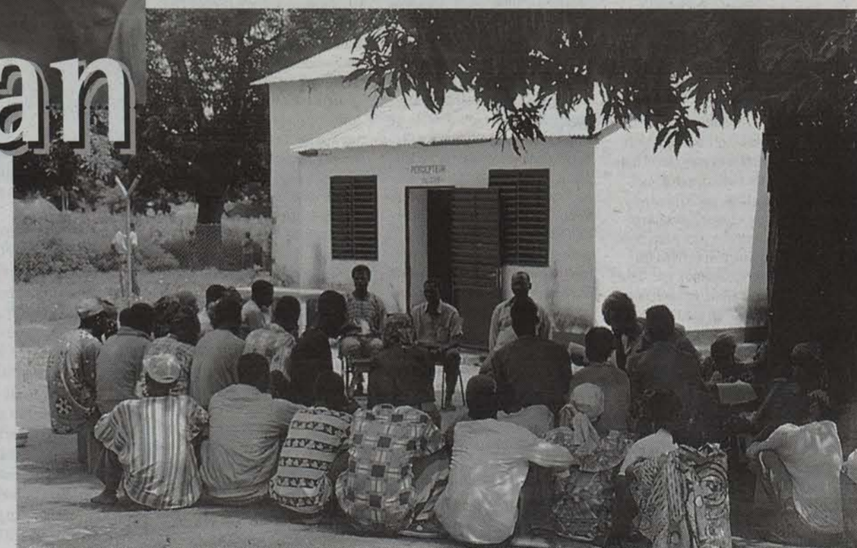
Moissalako ospitalean dauden gaixoen senideei oinarritzko osasun eta higie-ne eskolak ematen dizkiete astero.