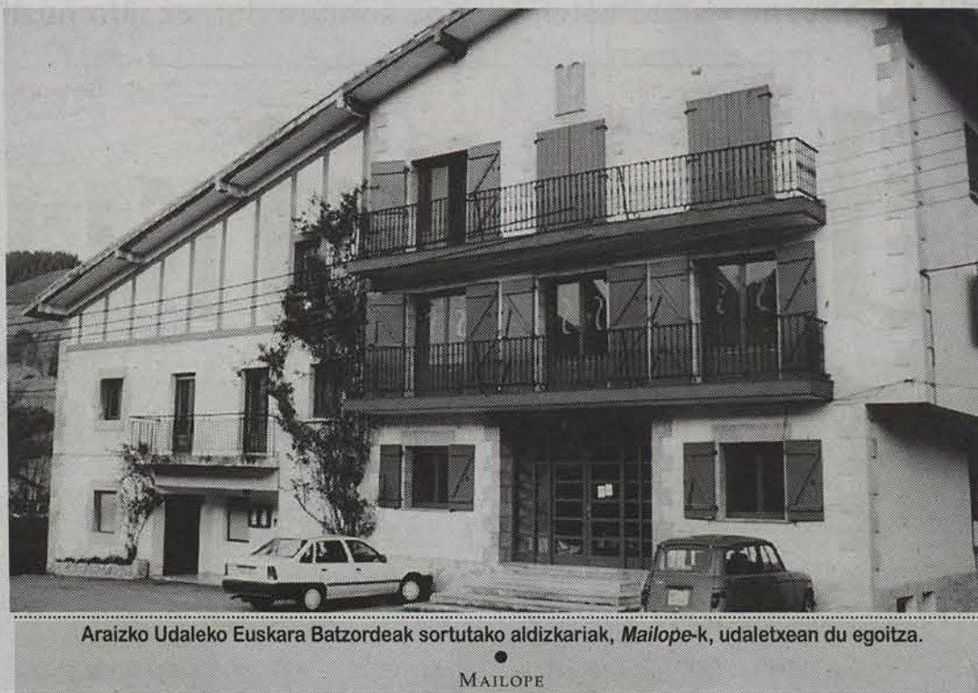
Araitzko Udaleko Euskara Batzordeak sortutako aldizkariak, Mailope -k, udaletxean du egoitza.

Duela hamar urte sortu zen Mailope aldizkaria, Araitz-Beteluko Euskera Batzordearen itzalean, baina egun ez du izaera juridikorik, ez du inongo erakunde argitaratzailerik. Diru arazoak konpontzeko bidea ere bada aldizkaria babestuko duen elkarte sortzea.