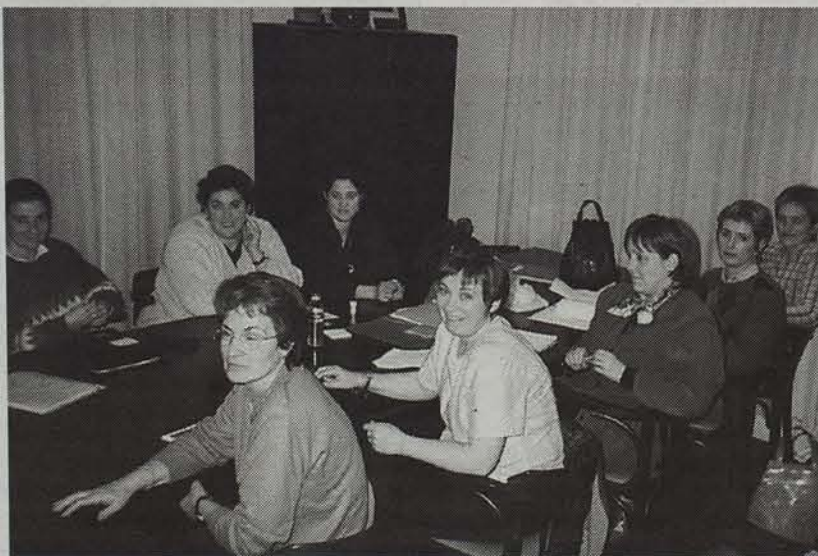
Eguzkilore elkarte sortu berriko kideek norbere buruarekiko maitasuna bultzatu nahi dute. • RAKEL GOÑI

Duela hiru urte elkartu ziren lehenengo aldiz, Elizondoko osasun etxean, erlaxatze ikastaro batean. Pixkanaka elkar ezagutzuz joan ziren, eta beren arazoak konpontzeko elkar laguntzea erabat onuragarria zela konturatu ziren.