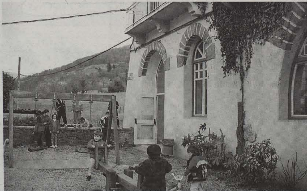
Haurrak jostatzeko eta ikasteko lekua da Aresoko liburutegia. • ELI BELAUNTZARAN

Nafarroa osoan gutxi izanen dira 310 bat biztanleko herriak 25 umerekin eskola dutenak. Azken hamar urte hauetan guraso elkartekoak arduratu dira zerbitzu horretaz.