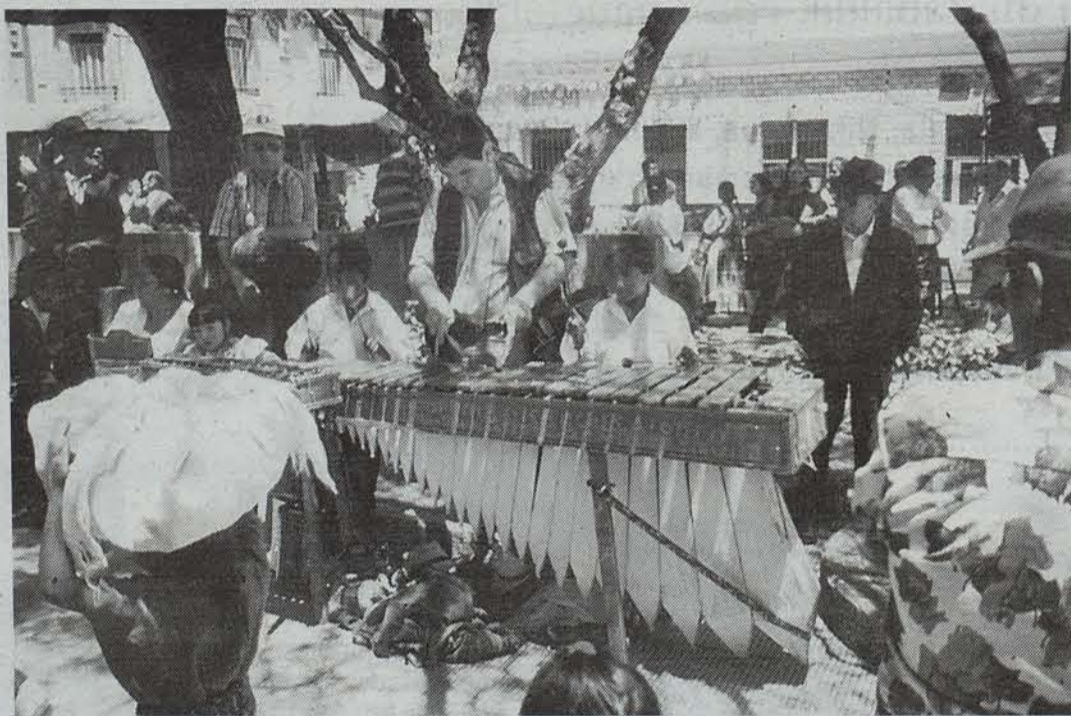
Quetzaltenango herriko merkatuan musikari batek egurrez eta kalabazez eginiko muninba tresna tradizionala jotzen du.