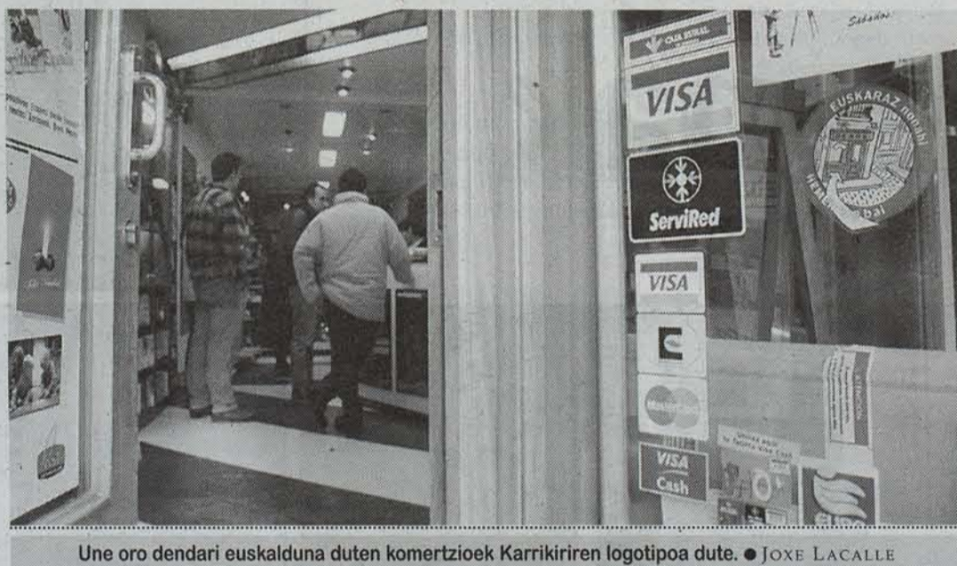
Une oro dendari euskalduna duten komertzioek Karrikiriren logotipoa dute.