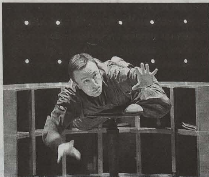
Izarren Bitakora antzezlanaren antzezlanaren irudi bat. ● MIKEL UHARTE

Astelehenean, azken 21 urteetako konstituzioak benetako demokrazia zaintzen ez duelakoan, preso politikoen egoera aztertuko dute mahai-