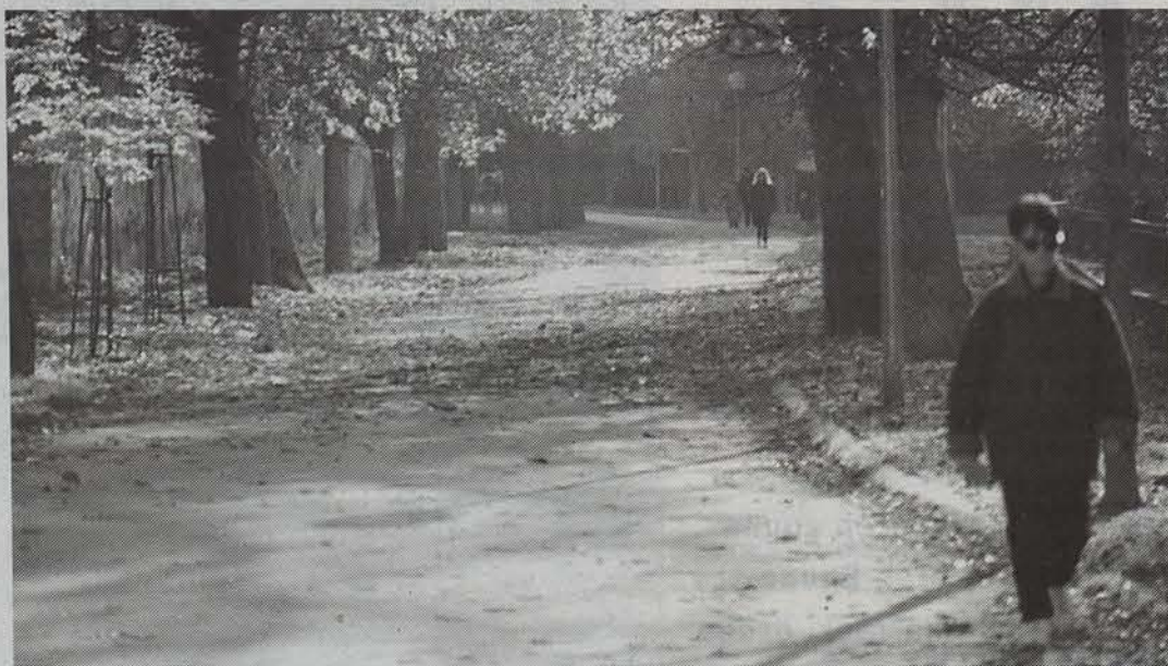
Los Llanos pasealekua da kaleratu berri den gidan aurki daitezkeen 11 ibilbideetako bat.

Ibilbide naturalistikoak Lizarran zehar izenburupean, hirian eta inguruetan egiteko zenbait ibilbide biltzen dituen gida bat karrikaratu dute. Bertan, txango bakoitzaren ezaugarriak aipatzen dituzte.