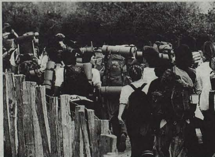
16 eta 25 urte arteko gazteek har dezakete parte igandeko ibilaldian.

Iruñeko Nafarroa Kirol Elkarteak Belagoako III. Gazte ibilaldia antolatu du, iganderako. 16 eta 25 urte bitarteko gazteek parte hartu ahal izanen dute.