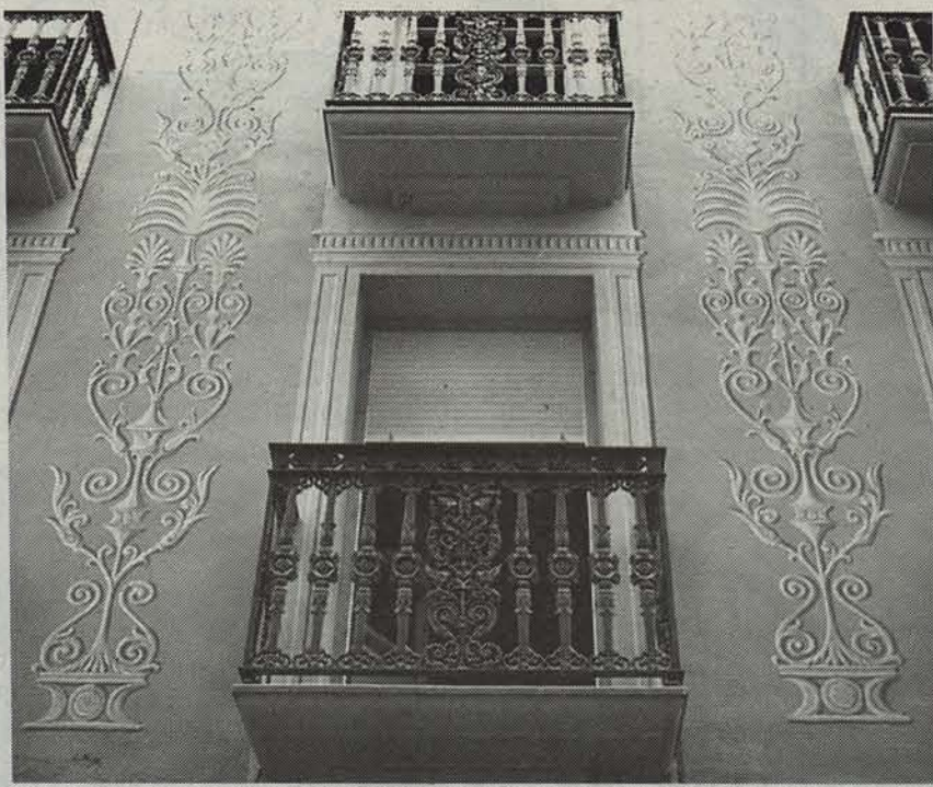
Azken egunotan margotu berri duten etxearen aurrealdea.

XIX. mendean Lizarran kolore anitzetako etxeak ikus zitezkeen. Egun, eraikinen aurrealdeetan antzinako margo horiek berreskuratzen ari dira, historiaren lekuko direnei garrantzia eman nahian.