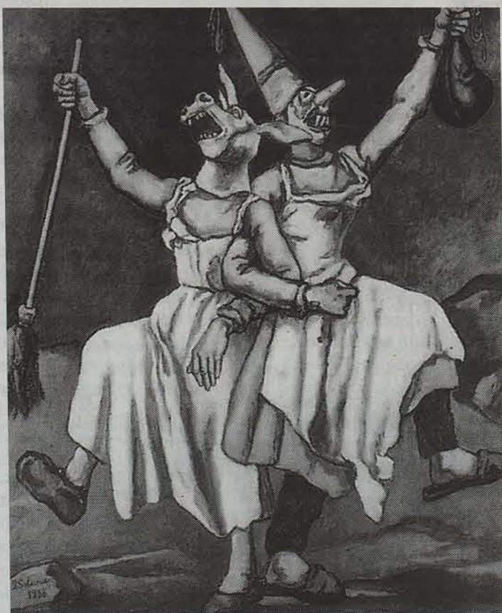
Jose Gutierrez Solanaren Mascaras bailando del brazo koadroa •

Mende honetako margolari gorenetak baten margolanak ikus daitezke aurreneko aldiz Nafarroan. Gustavo de Maeztu museoak Jose Gutierrez Solana artistaren sei olio, lau litografia eta hogei bortz akuarela bildu ditu urriaren 31 arte.