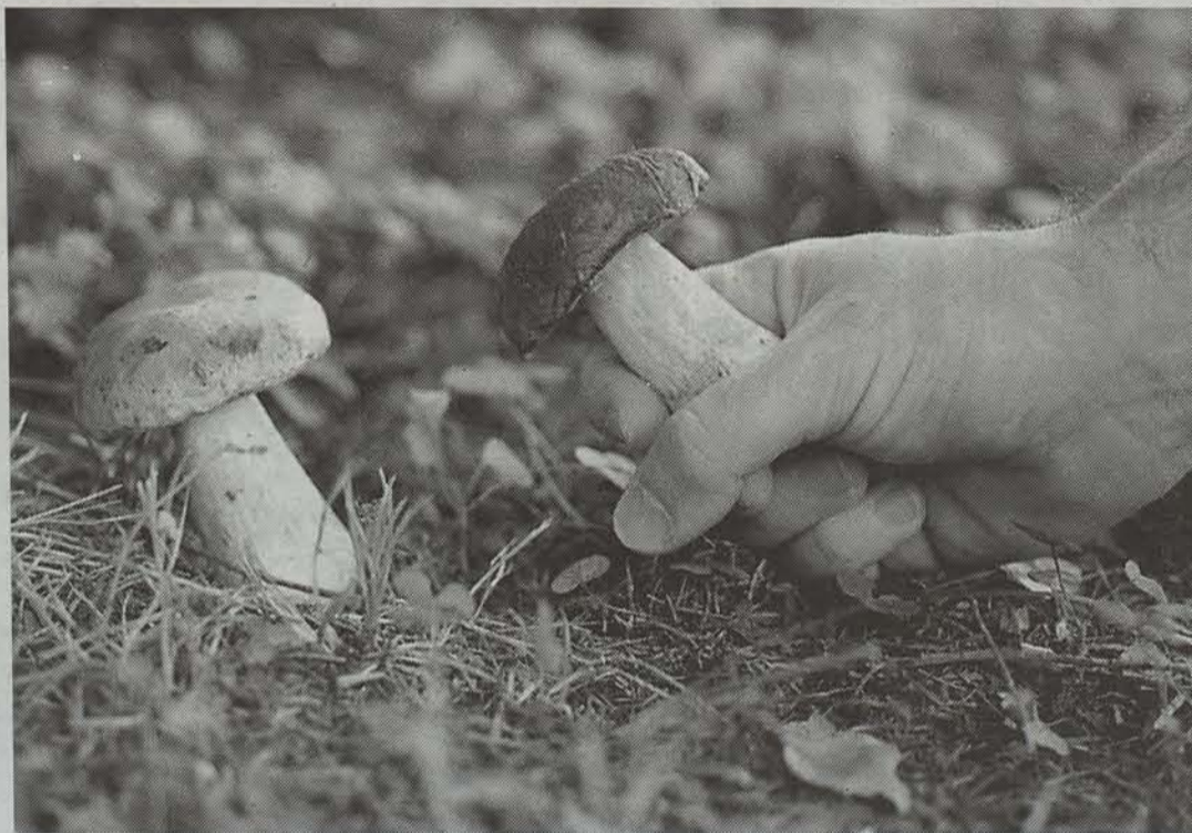
Etzi, Arozarenaren omenezko II. Onddo eta Ziza Txapelketa egiten dute Elgorriagan

Onddo garaian sartu ahala, gero eta jende gehiago joaten da mendira horien bila. Elgorriagan, onddoa hizpide hartuta, mota guztietako ekitaldiak egiten dira astebururo, urriaren 3a bitarte.