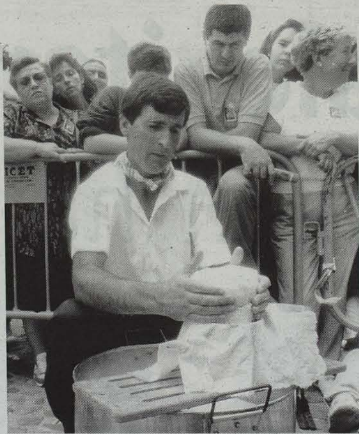
Artzain Egunean hainbat erakusketa izaten dira.

Lehiaketa ugari eta jai giroa izango da nagusi igandean Arakil-Uharten. Eta artzain txakurren txapelketa izango da, aurten ere, denetan arrakastatsuen.