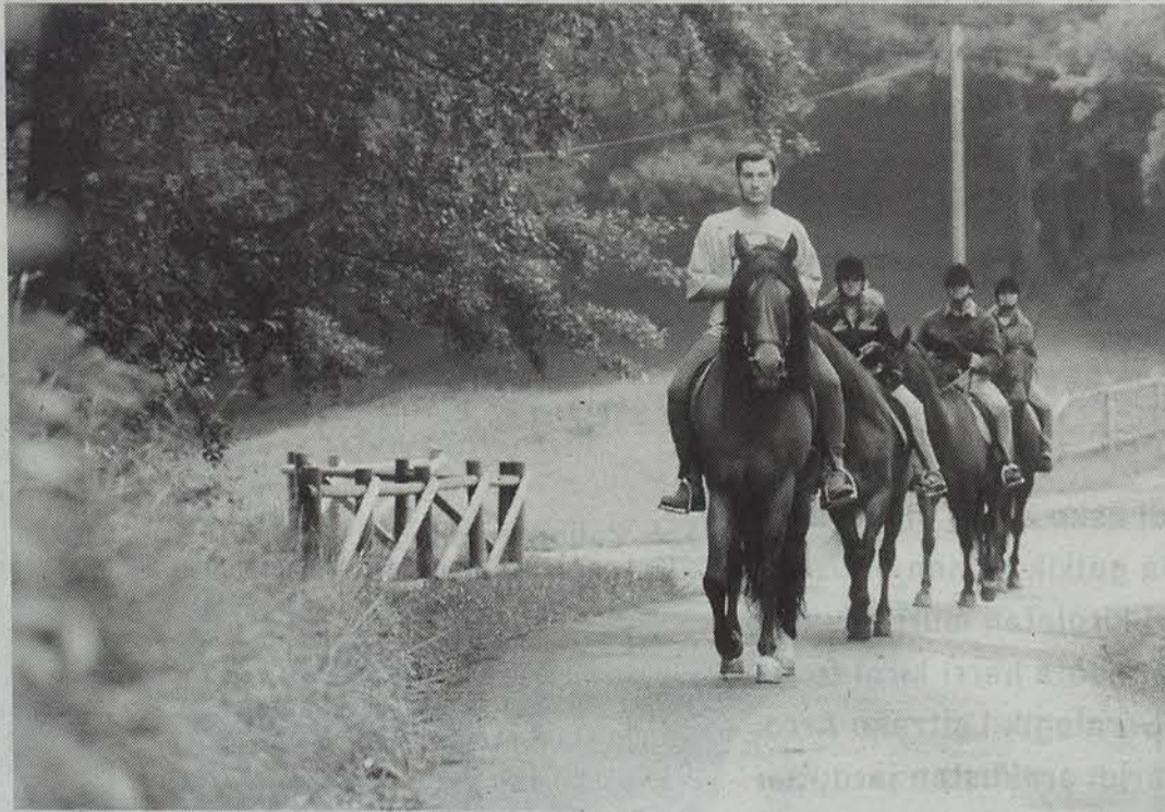
Aurrerantzean Bertizen ezin izanen da zaldiz ibili, BKZk bere zerbitzua eten baitu.

Orain sei urte Bertizko Parkean zabalduko zalditegiak atek itxi behar izan ditu, Oierregiko kontzejuko alkatearen eta zalditegiko arduradunen arteko tirabirak medio. Arazoa aspaldi hasi bazen ere, aste honetan jakinarazi dute aurrerantzean ez dutela zerbitzu hori eskainiko Bertizen.