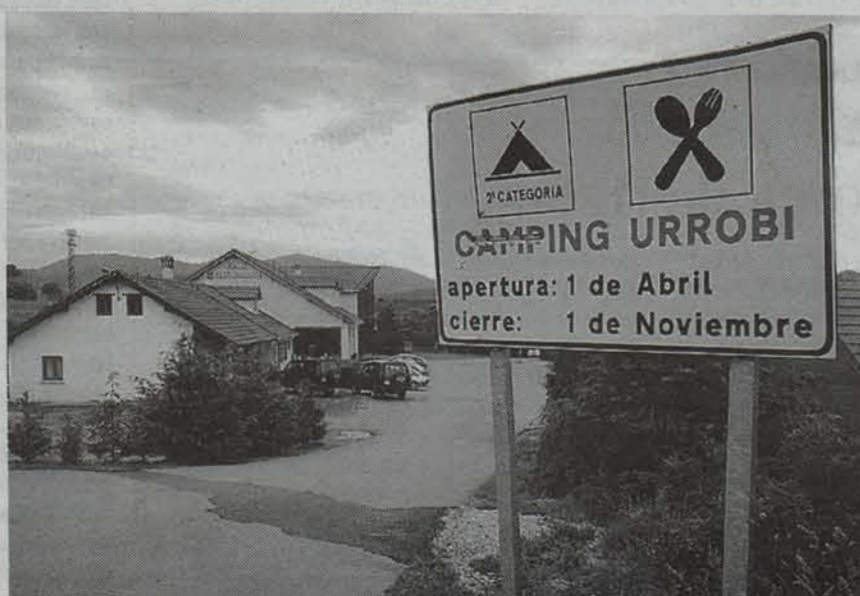
Aurizberriko Urrobi kanpina. ● MIKEL SAIZ

Trafiko handiko bidearen proiektua aurreratzen ari