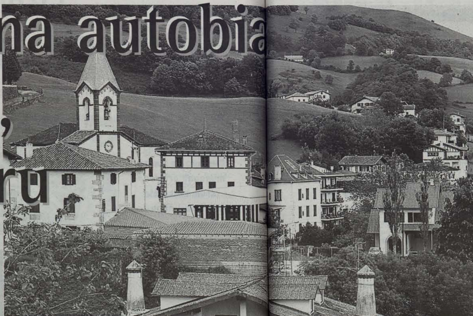
Luzaideko herritik pasako litzateke autobidea.

Nafarroako Gobernuak eta Atlantikoetako Kontseilu Nagusiak berriki Pauen aurkeztutako mugaz gaindiko autobidearen proiektuak hainbat iritzi sortu ditu Hegoaldean zein Iparraldean. Ustez bidea iraganen den herrietako auzapez askok eta Leia taldeak informazio falta salatu dute.