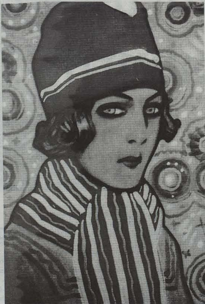
Emakumearen irudi berria ekarri zuen Penagosek.

Rafael de Penagos (1889-1954) izenburuean, Gustavo de Maeztu museoak art deco -aren maisu eta ordezkari nagusia izan zen artista horren lanak bildu ditu hilaren 27ra bitartean.