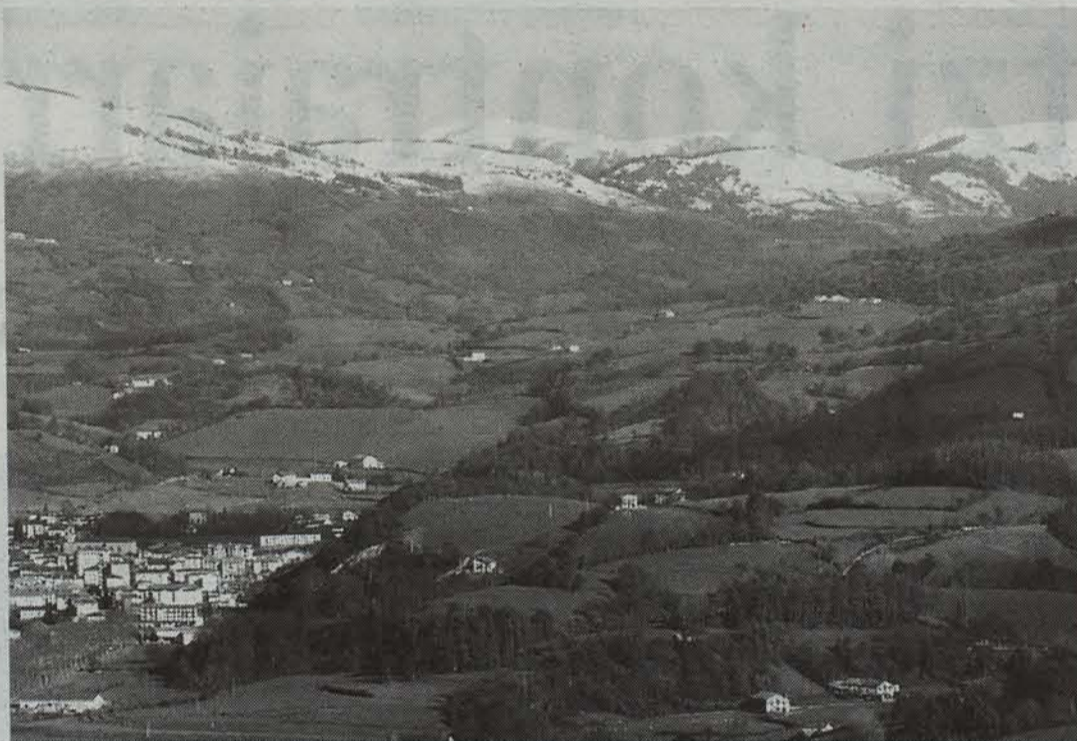
Baztango mendiak mendigoizalez beteko dira etzi.

Baztango Mendigoizaleak Elkarteak seigarren urtez jarraian mendi ibilaldia antolatu du etziko. Ibilaldiak orotara 32 kilometro izango ditu, eta Baztango mendi kasko ugaritan barrena iraganen da.