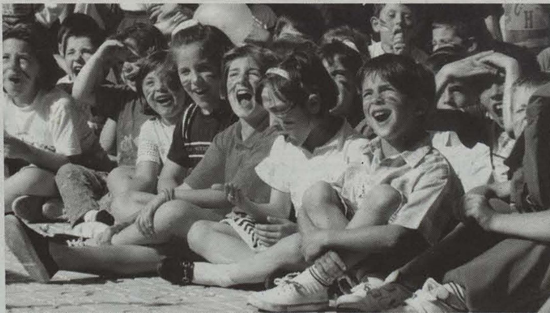
Umeek beren eguna ospatuko dute etzi.

Urteetan gertatu den moduan, hurrei eskainitako eguna izango da maiatzeko lehen igandea. Jolas eta ikuskizun ugari, Dantzari Egunari lekukoa hartu dion jai horretan.