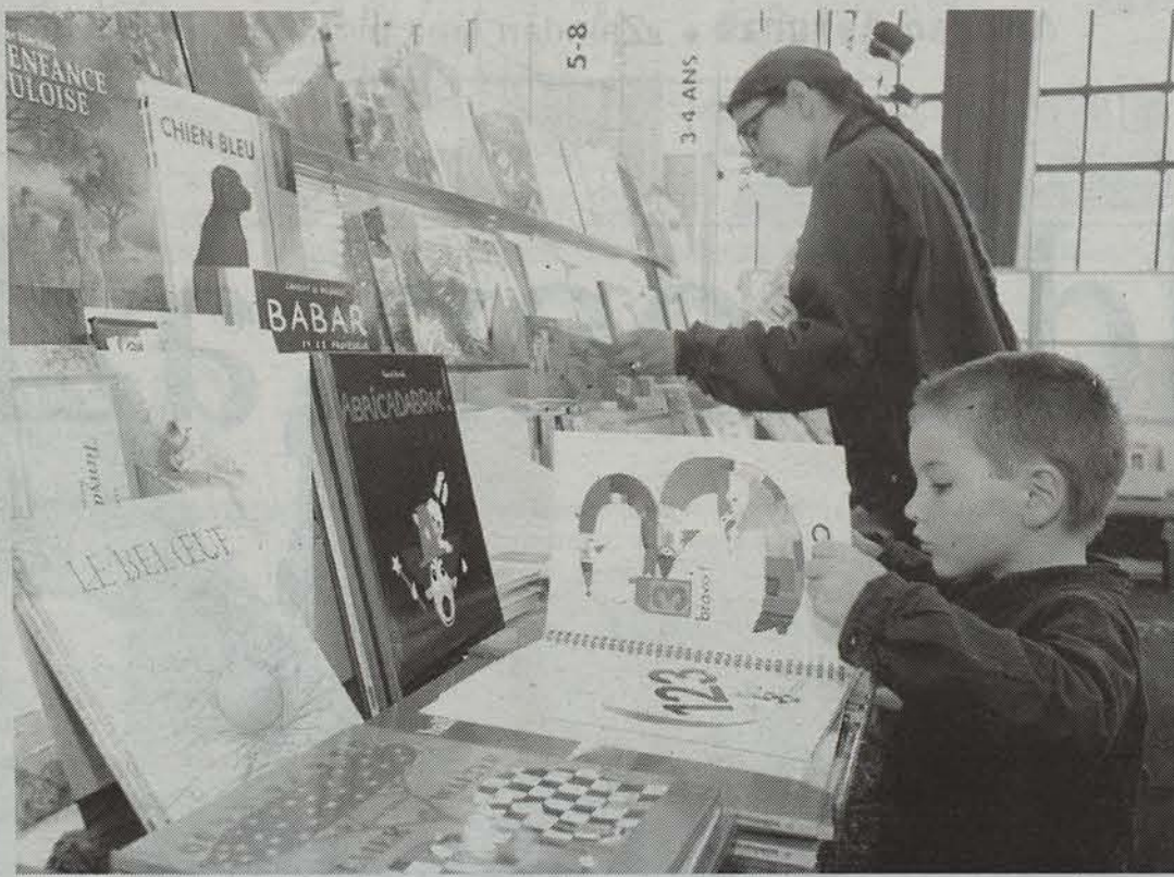
Hainbat ikaslek liburuetara hurbiltzeko aukera dute datorren astean Beran.

Apirilaren 23an Liburu Eguna ospatzen dela aitzakia hartuta, ttikienei literatura hurbiltzeko ekitaldi bat antolatu du Lamixine BAT antzerki taldeak, bigarrenkoz. Joan den urteko esperentziaren haritik, bertze ekitaldi bat antolatu dute datorren astelehenetik asteazkena bitartean.