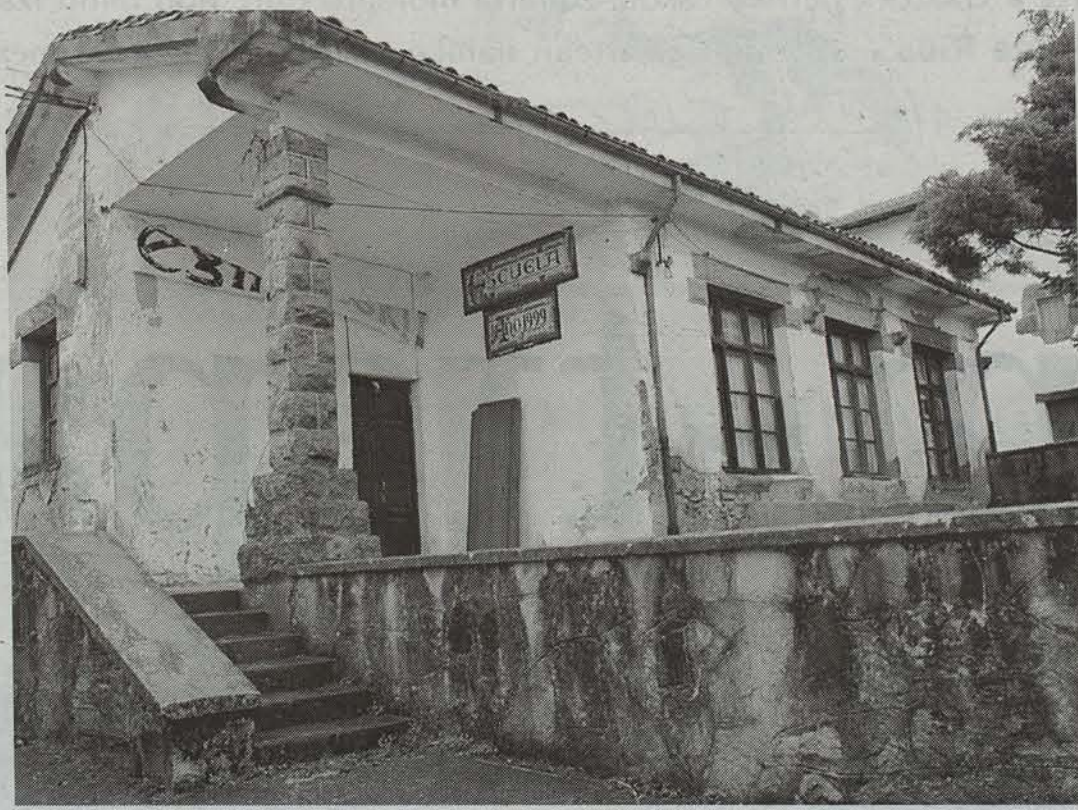
Herriko eskola zaharra, berritua.

Hamazazpi urtez itxita egon ondoren, berriro zabalduko da eskola zaharra. Ikasgairik ez da izango, baina aisialdia betetzeko aukera ezin hobea eskainiko die herriko gazteei. Horretarako, halere, lan gogorra egin dute.