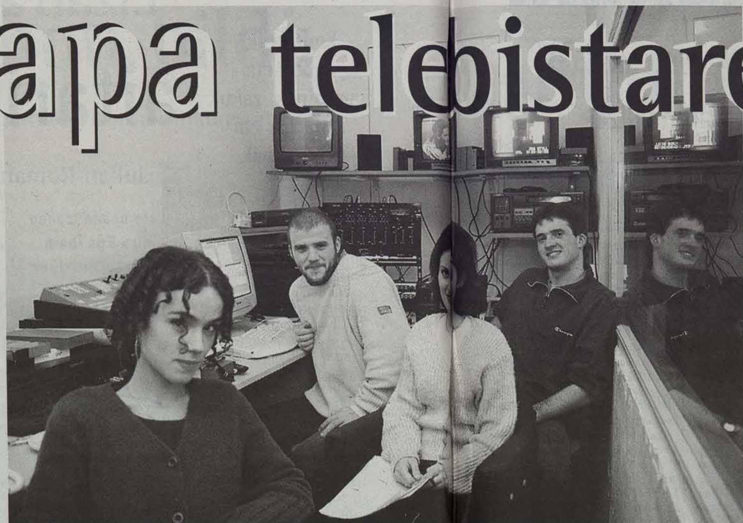
Ttipi-ttapa telebistako lantaldea, du Fernandez aurkezlea barne.

Dituen arazo ekonomiko larriak gainditzeko eta proiektua aurrera ateratzeko, diru bilketa kanpaina abiatu du Bortziritan