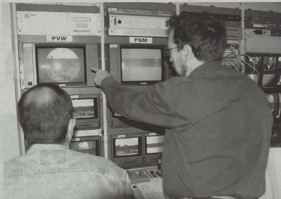
Gaur egun bor-bor dauden gaiak jorratzen ditu Lizarra Ikastolako antzerkitaldearen azken lanak, hala nola telebista edo zinemaren inguruko jendearen erotasuna.

Joan den ostiralean hasi zen Lizarran IX. Antzerki Gaztearen Erakustaldia eta gaur gauean ospatuko den saioak bigarrena egingo du. 1990. urtetik aitzina ospatzen den antzerki emanaldia gaur zortzi amaituko da Lizarherria Institutoko ikasleen partehartzearekin.