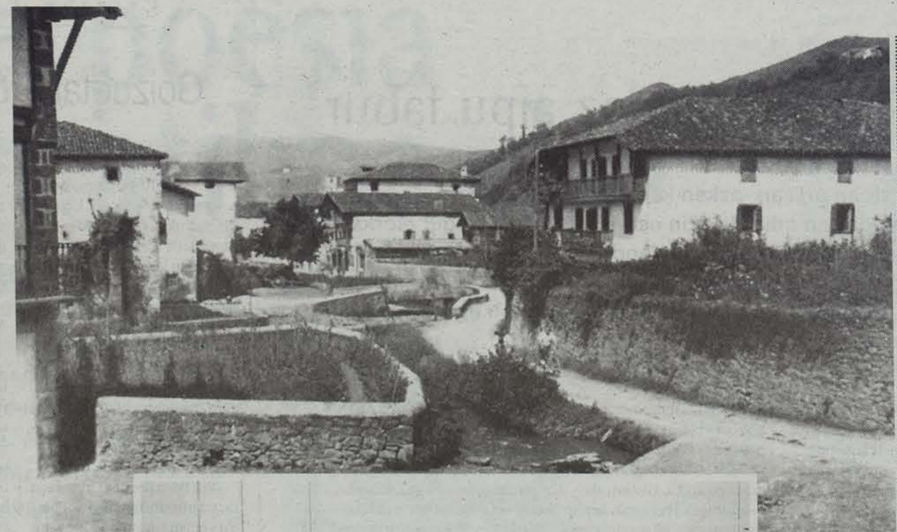
Berako irudi zaharrak. Historian gauzak zenbateraino aldatzen diren erakusgarri. ANTONIO OLLETA

gehiegirik erabili: artxibo historikoak, Nafarroako Protokoloak eta Artxibo Orokorrean begiratu ondotik egindako azterketak uste berriak harilkatzeko aukera eman die.