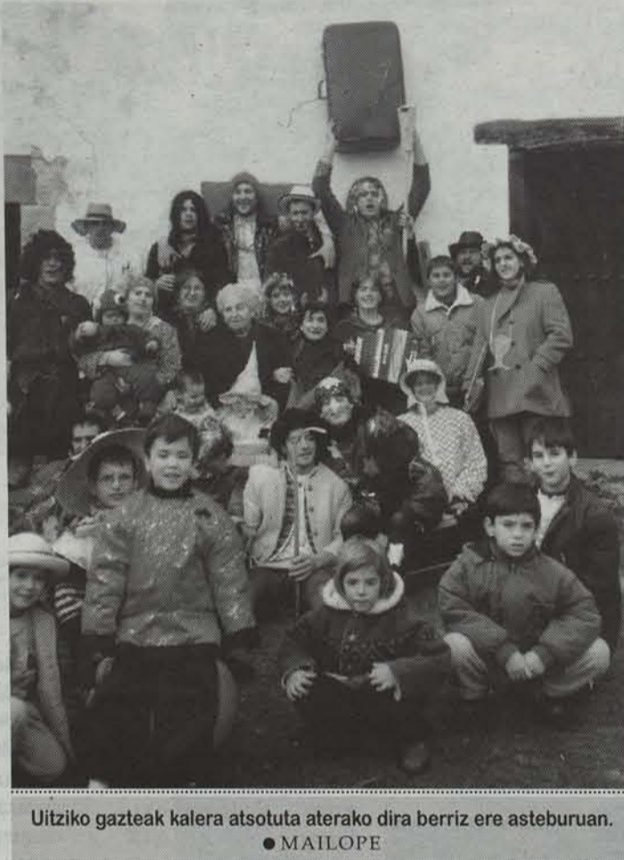
Uitziko gazteak kalera atsotuta aterako dira berriz ere asteburuan. ● MAILOPE

Maiordomoena bezelako ohitura zaharrek bat egingo dute, aurten ere, berriagoak diren beste zenbaitekin. Mozorrotuta lotsa galdu ohi del eta, aukera aprobetxatuko dute uitziarrek hargikeriaren omenezko jaia ospatzeko.