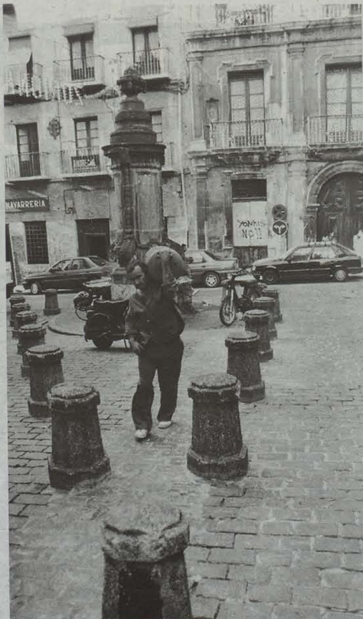
Proposamena onartuko balitz Navarrieriako plazak Zugarrondo izena hartuko luke aurrerantzean. ● OSCAR MONTERO

P ORTALEPEKO TXOKOA EDOTA Zugarrondoko plaza izenak ohikoak izanen dira aurrerantzean, baldin eta Toponimia Batzordeak egindako kale, auzo eta parajeei buruzko txostena onartzen badu Iruñeko udalbatzarrek. Aho batez onartutako proposamenak kale izendegia eta azpiegitura askoren (zubi, jauregi, monumentu) euskarazko deiturak ere jaso ditu. Iruñeko udaletxean euskara bultzatzeko asmoz egindako ordentza baten haritik sortu zen Toponimia Batzordea, joan den urtean. Batzordean gaiarekin zerikusi duten erakundeen ordezkariak daude: bi unibertsitateetako kideak, Gobernuko zein udaletxe-ko artxiboetako arduradunak, Euskaltzaindiko ordezkari bat, eta udaletxe-ko euskara teknikaria zein itzultzailea. Horrela, Iruñeko auzo, kale eta azpiegiturak deitzeko irizpideak finkatu ditu, gaztelaniaz zein euskaraz.