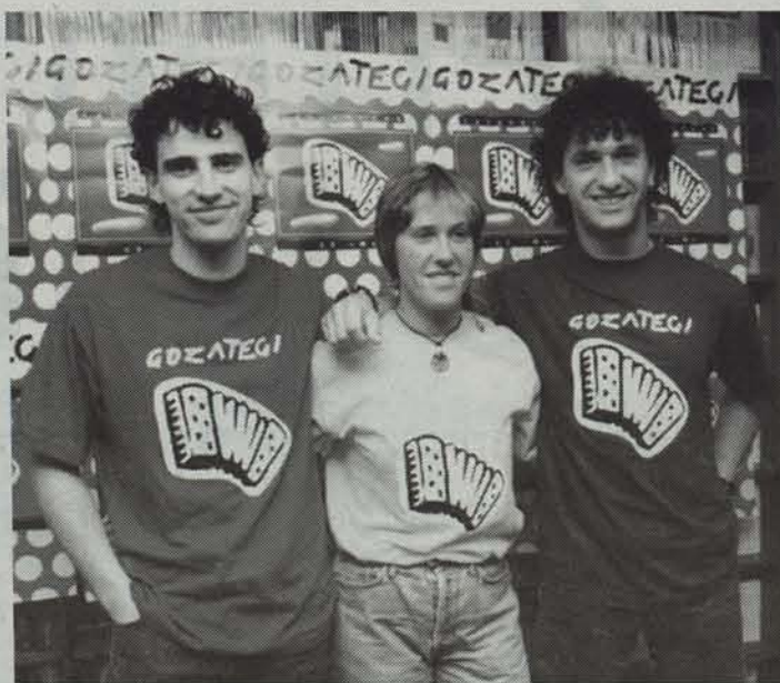
Gozategi taldea izanen da Folk Ametsetan ibilaldian ariko dena.

Javier Krahe ere arituko da kanpaina honetan. Abizenak bestelakorik pentsarazten badu ere,